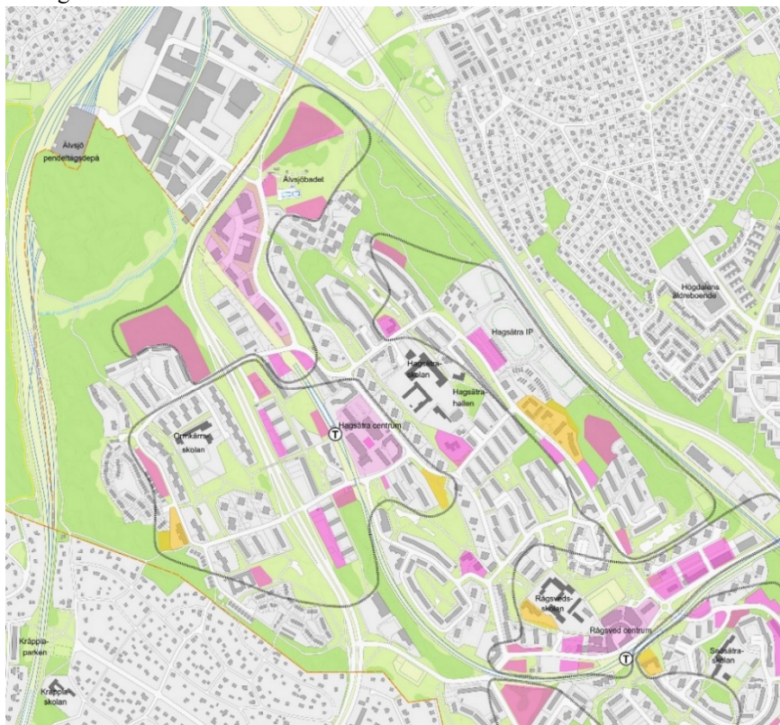
Bild: Utsnitt ur översiktsillustration Fokus Hagsätra Rågsved. Rosa ytor visar potential för bostäder, arbetsplatser och service. Gula ytor visar platser för utökade eller nya skolor och förskolor.

Avgränsningen av naturreservatet har utgått ifrån områdets befintliga och potentiella värden och vägts mot stadens behov av framtida markreserver för exempelvis bostäder och infrastruktur. Arbetet med förslaget har skett i nära samverkan med stadsutvecklingsprojektet Fokus Hagsätra Rågsved. Ytor som identifierats som lämpliga att pröva för bebyggelse i arbetet med Fokusområdet har lämnats utanför reservatet, samtidigt som till exempel sambandet mellan Hagsätraskogen och Rågsveds naturreservat utmed kommungränsen har kunnat inkluderas.