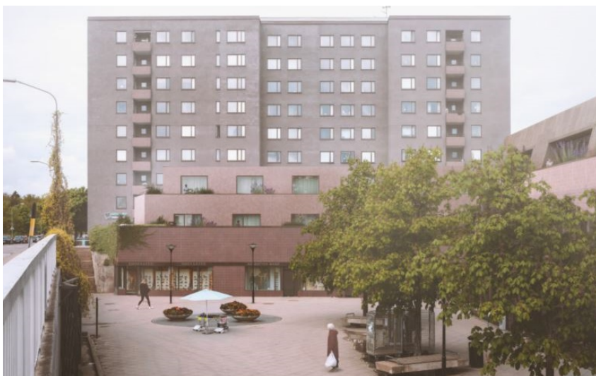
Vy från Selmedalsvägen väster över torget mot föreslagen påbyggnad centrumlokaler i öster. (Bild: Jägnefelt&Milton)

De låga centrumbyggnaderna byggs på i en till två våningar. Centrumbyggnaden i väster byggs på i två terrasserade våningar utförda med platt tak. Fasader utförs i klinker lik den på befintlig byggnad, men i avvikande form och kulör. Centrumhuset på torget byggs på i en våning. Befintligt band av kopparplåt i ovankant fasad på centrumhuset ersätts med klinker lik den på befintlig byggnad, men i avvikande form och kulör. Fasaderna, som på långsidorna lutar svagt inåt, utförs i mörk plåt. Ovan regleras med planbestämmelser.