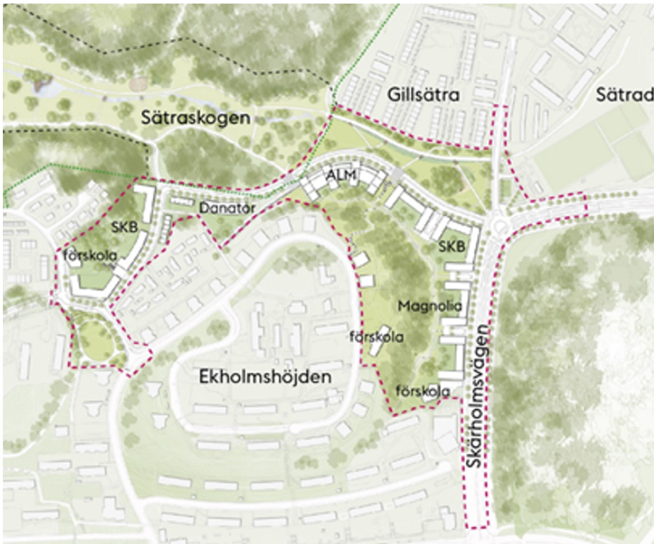
Bild 1. Illustrationsplan Skärholmsdalen. Streckad linje visar ungefärligt planområde. Röd prick redovisar att kvarteret ännu inte markanvisats. Nyréns arkitektkontor.

Projektet syftar till att utveckla en kvalitativ och socialt hållbar stadsmiljö i norra Skärholmen med utgångspunkt i omgivande miljöns karaktärsdrag och värden. För Skärholmsvägen skapas förutsättningar för en stadsgata med bebyggelse längs ena sidan, utbyggnad av spårväg syd, bättre kopplingar till intilliggande stadsdelar och ökad tillgänglighet för fotgängare och cyklister.