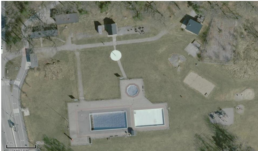
Flygfoto över Älvsjöbadet

Inriktningsbeslut fattades av fastighetsnämnden (dnr FSK 2021/409) och idrottsnämnden (Dnr IDN 5.1.1/2021/2307) i mars 2022.