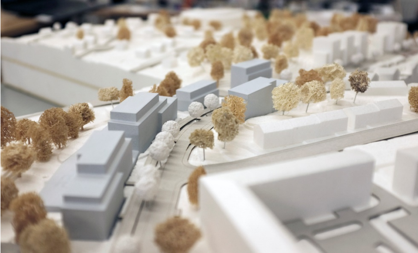
Föreslagen bebyggelse längs med Bredängsvägen. Släpp mellan hus möjliggör för inblickar mot naturmark.