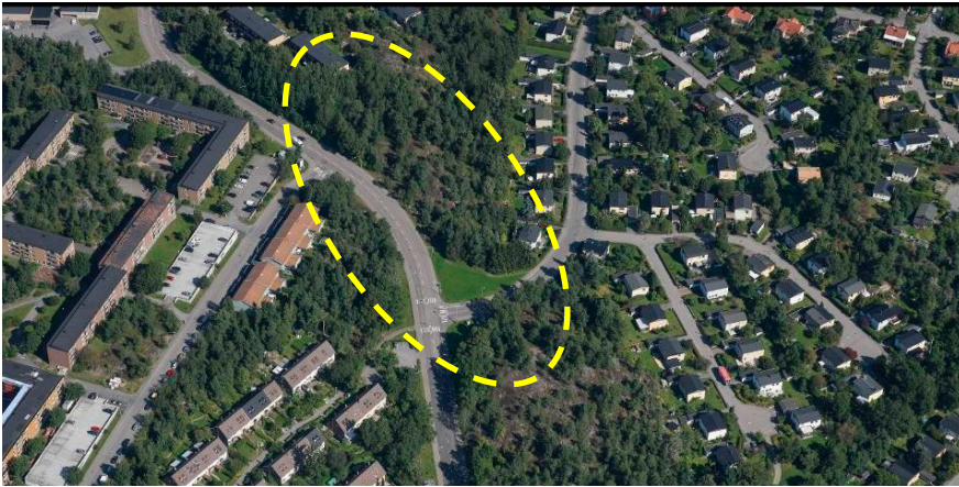
Ortofoto. Planområdet är ungefärligt markerat med streckad linje.