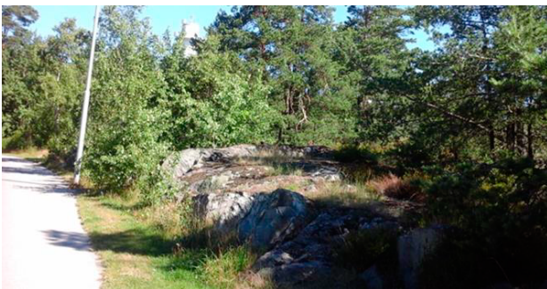
Planområdets östra sida med hållmark och berg i dagen.