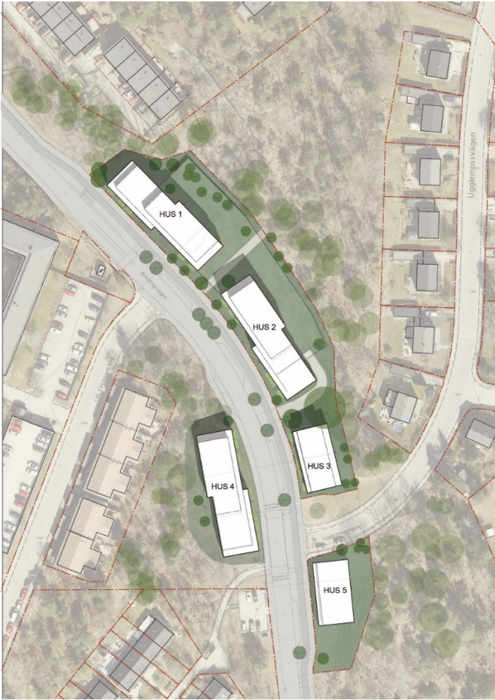
Illustrationsplan föreslagen bebyggelse omformad gata och utbredning av kvartersmark och gårdsytor, stadsbyggnadskontoret