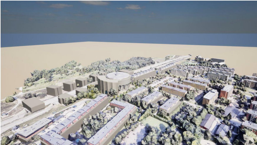
Figur 2. Gestaltning över området med ny reservoar på plats

För att projektet ska vara genomförbart behövs bra samverkan med projektet Tenstaterassen men även samverkan med stadsdelsnämnden och trafiknämnden för att byggvägar och tillgängliga ytor ska kunna användas optimalt. Stockholm Exergi och andra ledningsägare har anläggningar i området och på fastigheten som också kräver samordning.