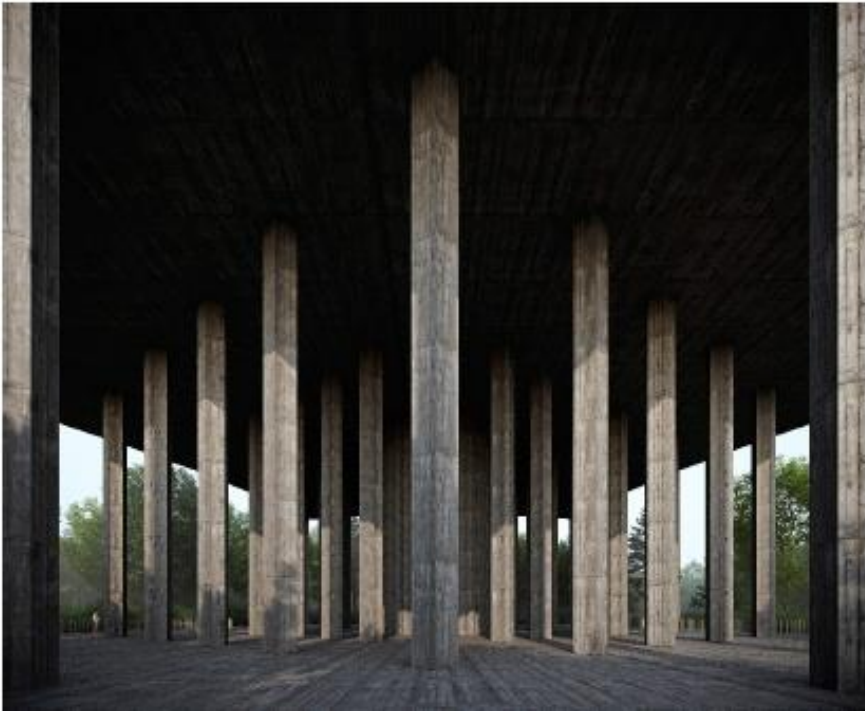
Vattencisternen vilar på ett mittorn omgärdat av en pelarsal.

Byggnaden utförs i betong, gjutna mot brädform. På den övre delen som rymmer vattencisternen ges fasaderna en dekoration i relief. Den djupa reliefen ger byggnaden en detaljering som kan upplevas både på nära och långt håll.