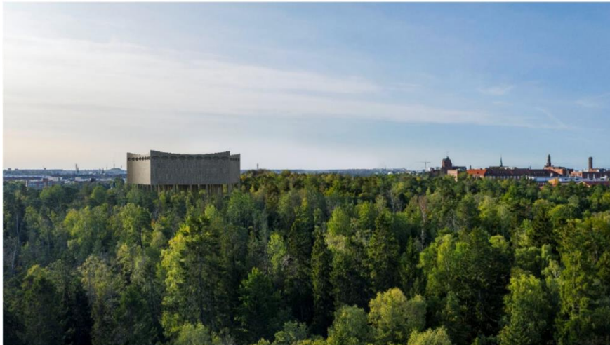
Pentagonformen exponerar flera fasader och de konkava sidorna skapar ett spel mellan ljus och skugga på byggnaden. Drönbild mot sydväst.

konkava fasaderna reflekterar ljuset och skapar ett spel mellan ljus och skugga på byggnaden. Ambitionen är att förankra byggnaden i parklandskapet på Djurgården. Vattencisternen vilar på ett mittorn och en högrest pelarsal. Pelarsalen monumentaliserar anläggningen och anspelar på det antika rundtemplet. Byggnaden samspelar med den omkringliggande naturen genom de många pelarna som utgör en suggestiv skog i skogen. Vattenreservoaren är ett skyddsobjekt och omgärdas av ett staket som utformats i samklang med byggnadens arkitektur och den känsliga platsens värden. Utanför planområdet anläggs en ny angöringsväg samt en serviceyta närmast byggnaden. Dessa ska utföras i ett genomsläppligt material och i huvudsak vara vegetationsbeklädda. Syftet är att ytorna ska integreras med det omgivande parklandskapet. Efter färdigställandet av den nya vattenreservoaren kommer den äldre vattenreservoaren rivs och platsen återställas till naturmark. Syftet är att ersätta den naturmark som tas i anspråk av den nya vattenreservoaren. Arkitektonisk idé Den nya vattenreservoaren uppförs i en riktningslös volym med fem hörn, en pentagon. Pentagonformen exponerar flera fasader och bryter ned skalan. Byggnadens fem sidor utförs konkava och hörnen accentueras med en förhöjning vilket innebär att dess avslut tecknar sig som en krona i stadens siluett. De konkava fasaderna reflekterar ljuset och skapar ett spel mellan ljus och skugga på byggnaden.