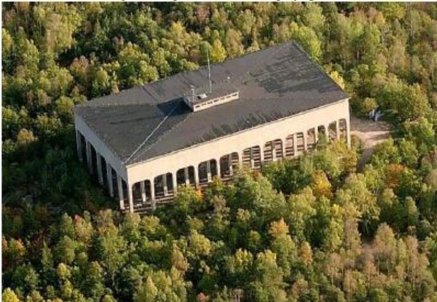
Den befintliga Uggleviksreservoaren på Kattrumpsbackens topp i Lill-Jansskogen togs i drift 1935. Ritad av arkitekten Paul Hedqvist.

ett kärnområde i ett av stadens ekologiskt särskilt betydelsefulla områden. Planområdet utgör även en liten del av habitatnätverk för barrskogsfåglar, groddjur och eklevande arter. Ekbeståndet i Nationalstadsparken är särskilt värdefullt för parkens naturmiljövården. Vidare ligger planområdet inom ett kärnområde för Järvakilen som är en av regionens gröna kilar. Uggleviksreservoaren är en av Stockholms större vattenreservoarer, ritad av arkitekten Paul Hedqvist och togs i drift 1935. Platsen för byggnaden betraktades även vid tiden för uppförandet som ett känsligt landskap varför Hedqvist utformade byggnaden i ett utbrett liggande plan med en pelarhall med höga betongpelare som bär upp den väldiga vattenbehållaren. Anläggningen är utformad med klassicistiska attribut i tempelform med pelare och kapitäl. Byggnaden är uppförd helt i betong och utformningen är starkt förenklad vilket för tankarna till funktionalismen. I Stadsmuseets kulturhistoriska klassificeringskarta är Uggleviksreservoaren markerat med grönt. Det innebär att byggnaden har höga kulturvärden och att den är särskilt värdefull från historisk, kulturhistorisk, miljömässig och konstnärlig synpunkt.