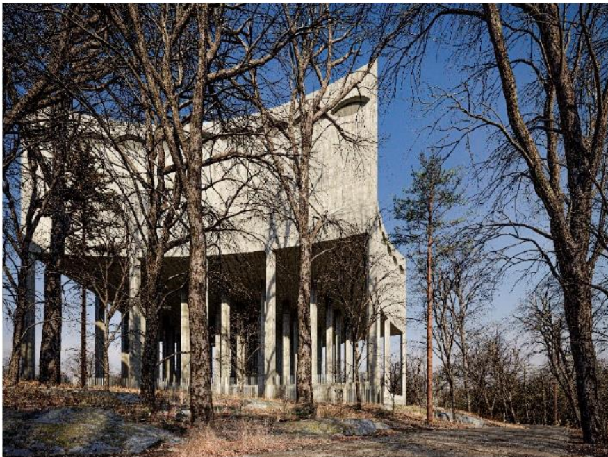
Den nya vattenreservoaren gestaltas med längsgående dekoration i djup relief. I en av dessa håligheter anornas en häckningsplats för berguv. Källa: Wingårdhs Arkitekter

Byggnaden utförs i betong, gjutna mot brädform. På den övre delen som rymmer vattencisternen ges fasaderna en dekoration i relief. Den djupa reliefen ger byggnaden en detaljering som kan upplevas både på nära och långt håll.