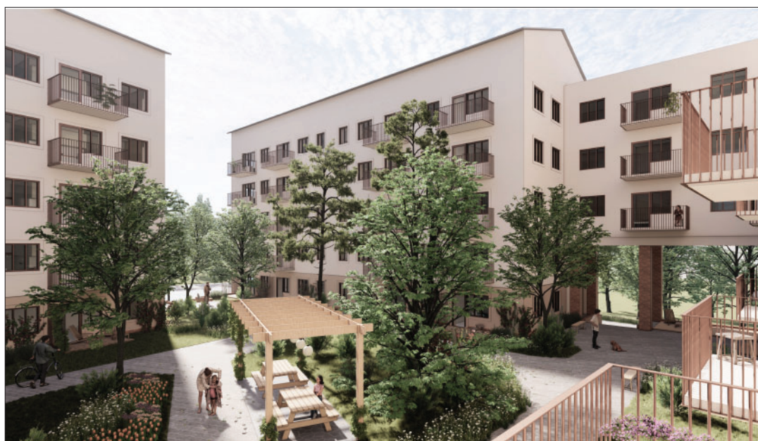
Vy över gården mot de nya bostadshusen i den nordvästra delen av kvarteret. Bild: Varg arkitekter och Norconsult.