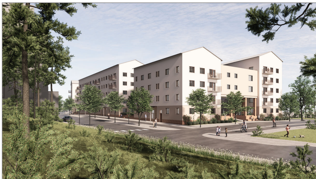
Svenska Bostäders kvarter sett från sydväst. Bild: Varg arkitekter.

Förutsättningarna för att uppnå Stockholms stads krav på grönytefaktor behöver studeras vidare. Eftersom stora delar av gården är underbyggd försvåras möjligheterna att plantera ett större antal stora träd.