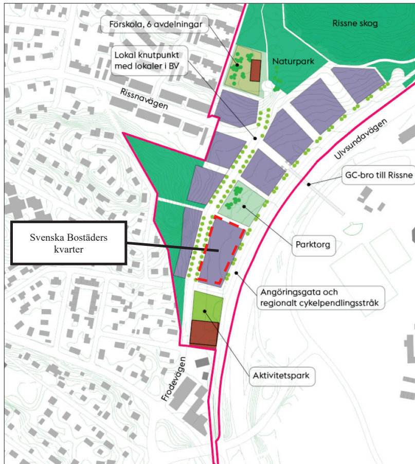
Illustrationsplan från Stadsbyggnadskontorets start-PM för Bromstensgluggen 2020-11-12. Svenska Bostäders kvarter har markerats med röd streckad linje.

Enligt planförslaget förlängs de befintliga gatorna Frodevägen och Rissnavägen norrut respektive österut och kopplar ihop Bromsten och Rissne via en gång- och cykelbro över Ulvsundavägen. Bolaget betonar vikten av att gång- och cykelbron genomförs då den avsevärt förkortar avståndet till spårbunden kollektivtrafik och serviceutbudet vid Rissne centrum, som blir tillgängliga inom knappt 1 km gångavstånd från projektet.