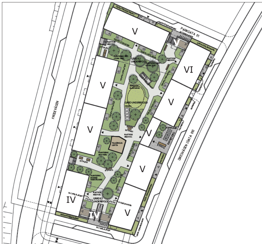
Situationsplan över Svenska Bostäders kvarter. Bild: Varg arkitekter och Norconsult.