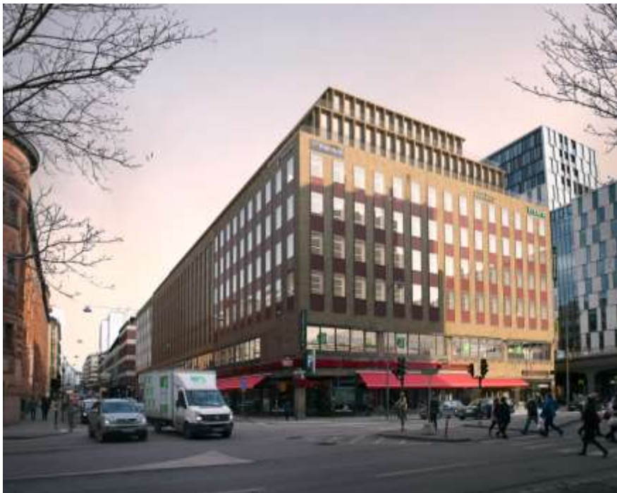
Planförslaget med påbyggd terrass mot Mäster Samuelsgatan, kortsidan mot Vasagatan, samt med två påbyggda indragna kontorsvåningar. Arkitekt: