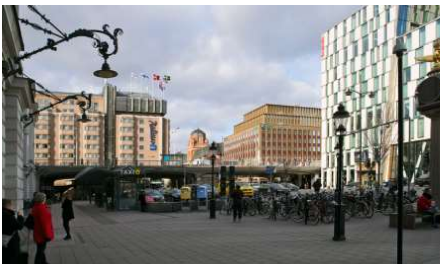
Vy från Centralplan. Illustration av detaljplaneförslag. Arkitekt: