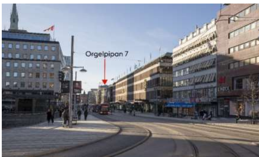
Fastigheten Orgelpipan 7 ligger intill Åhlénshuset mot Vasagatan. Byggnaderna längs Klarabergsgatan är i stort sett oförändrade sen tillkomsten på 1950–60-talen.

I de långa vyerna bedöms byggnaden som helhet smälta in i det modernistiska byggnadsbeståndet längs med Vasagatan. Inga utpekade siktlinjer bedöms påverkas negativt av påbyggnaden. Förslaget har ingen påverkan på befintlig planstruktur av kulturhistoriskt värde. I de nära vyerna, på kvartersnivå, blir förändringen mer påtaglig. Byggnaden blir högre och terrassen med träd mot Mäster Samuelsgatan försvinner.