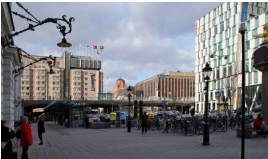
Vy från Centralplan. Fotot illustrerar befintlig situation.