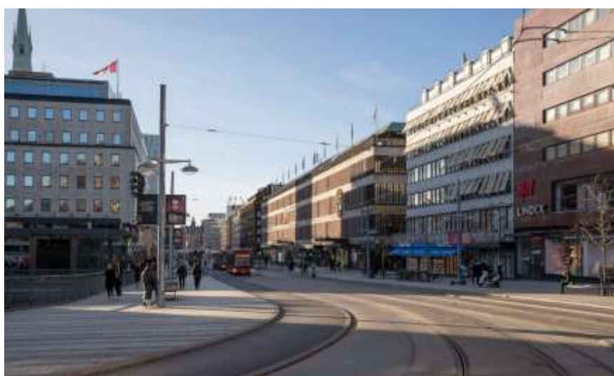
Illustration av detaljplaneförslag, Vy från Klarabergsgatan/Sergels torg. Illustrationen redovisar befintlig byggnadsvolym, föreslagen påbyggnad och takterrass. Arkitekt: