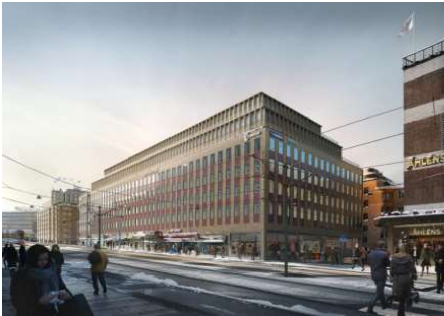
Planförslaget sett från Klarabergsgatan, vy mot nordväst. Arkitekt:

byggnaden blir högre. Det är framförallt Mäster Samuelsgatans gaturum som påverkas.