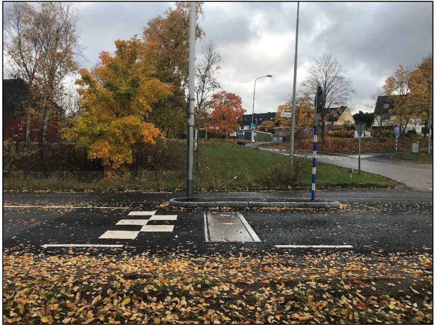
Figur 9: Dynamiskt farthinder.