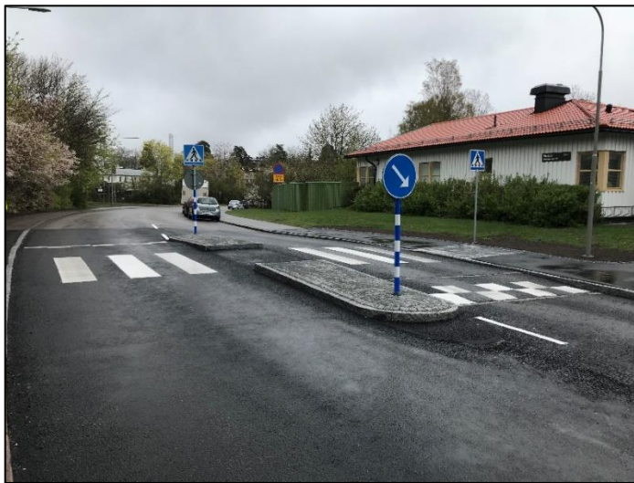
Figur 3: Upphöjt övergångsställe med refug och påfartsramp samt lång nerfartsramp