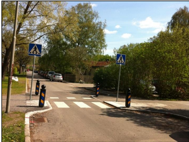
Figur 5: Avsmalning av körbanan

Detta innebär att gatan görs så smal att endast ett fordon kan passera i taget. Gående har bara ett körfält att korsa, men fordonen kan komma från båda håll. Det går att låta biltrafiken mötas utan reglering eller så bestäms vilken riktning som har företräde. Dessa platser kan även utformas med refug på vardera sidan om avsmalningen så att bilarna måste färdas med sidoförskjutning (chikan), vilket gör att hastigheten sänks.