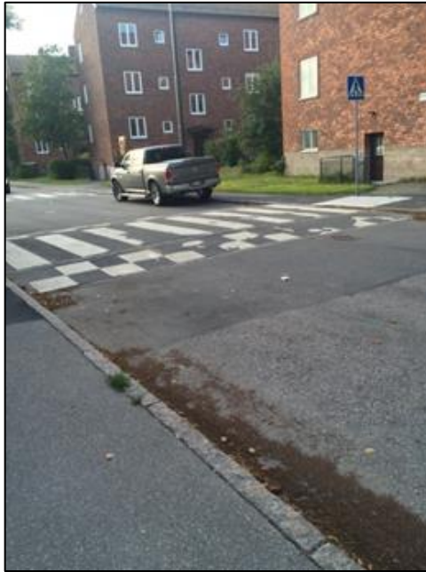
Figur 2: Upphöjt övergångsställe (platågupp)