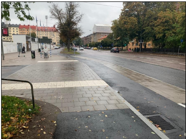
Figur 4: Genomgående gångbana