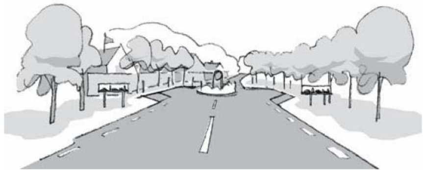
Figur 9: Avsmalning med port

Port är en fartdämpande åtgärd som är lämplig vid entrén till en tätort eller ett område i en tätort. Avsmalningen och fartdämpningen kan utformas som en förskjutning, gupp, cirkulationsplats eller förträngning. Fartdämpningen kan även utformas med planteringar, beläggning, portaler m.m.