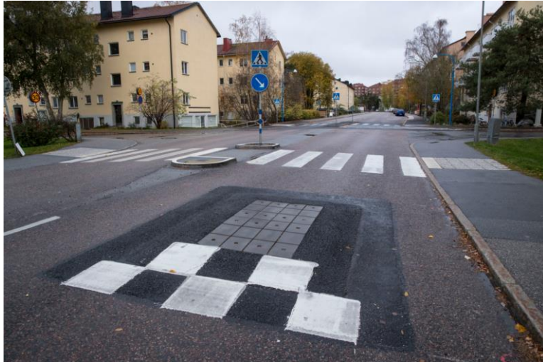
Figur 8: Väggkudde (busskudde)