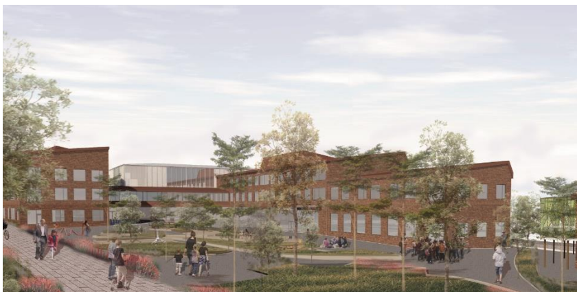
Skolgården med en öppen skolgård med ytor för lek. Illustration Cedervall arkitekter.