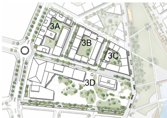
Illustrationsplan med kvartersnamn. Illustration White Arkitekter.

Detaljplanen utgör den tredje bebyggelsestappen på Årstafältet och omfattar en del av fältets västra sida. Planen består av tre kvarter med bostadsbebyggelse (3A, 3B och 3C) med lokaler i bottenvåningen utmed huvudgatan och aktivitetsbryggan samt ett skolkvarter (3D) som även inrymmer förskola och en fullstor idrottshall samt en elnätsstation. Kvarter 3A inrymmer också en förskola. Skolan och idrottshallen byggs samman och utgör en stor byggnadsvolym som dominerar stadsbilden och utgör viktiga målpunkter. Skolgården öppnar sig mot parken.