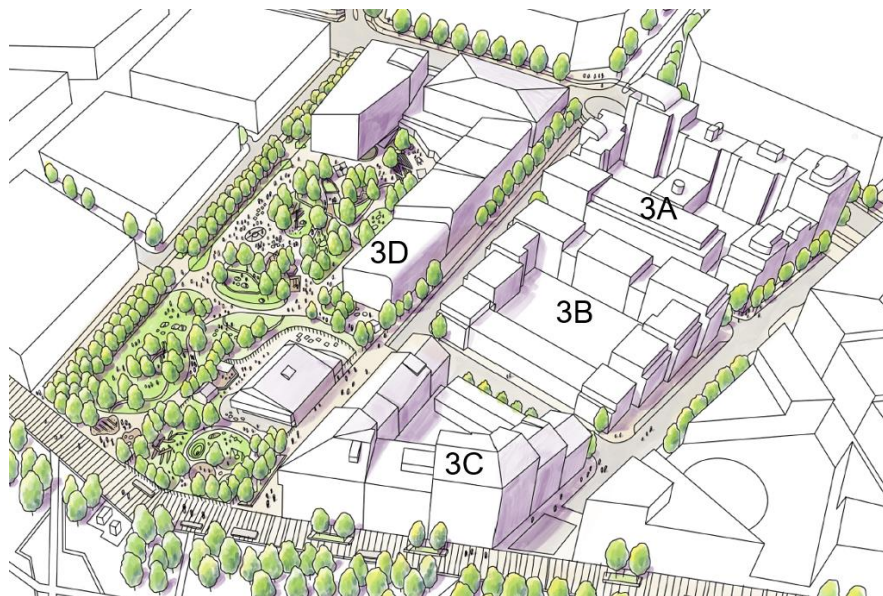
Volymstudie med kvartersnamn. Illustration Landskapslaget.

Även våningshöjder har varierats baserat på vilken typ av offentlig miljö de ansluter till. Mot huvudgatan är bebyggelsen något högre medan den genomsnittliga våningshöjden är något lägre mot de mindre trafikerade lokalgatorna och gångfartsgatorna. Det finns även inslag av stadsradshus för att bryta ner skalan och variera gestaltningen.