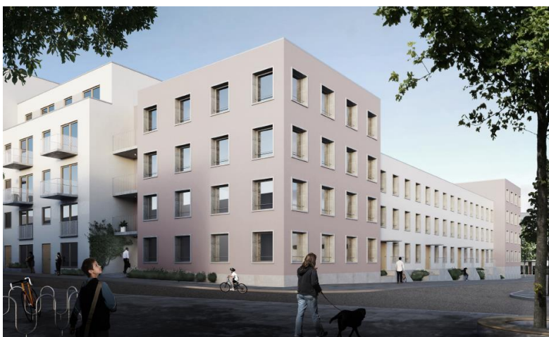
Kvarter 3B sett från söder med en långa radhus i tre våningar i ljusrosa puts. Illustration Arkitema architects och Esencial arkitekter.