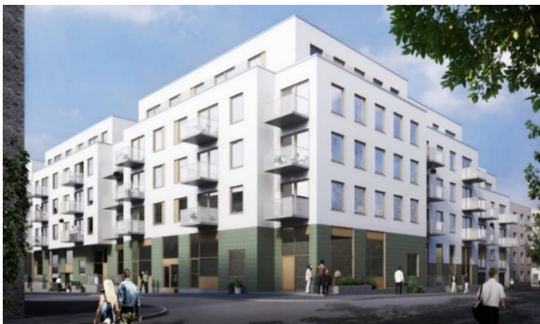
Kvarter 3B sett från norr (mot kvarter 3A i bilden ovan) med uppbrutna volymer med ett band i grön klinker. Illustration Arkitema architects och Esencial arkitekter.