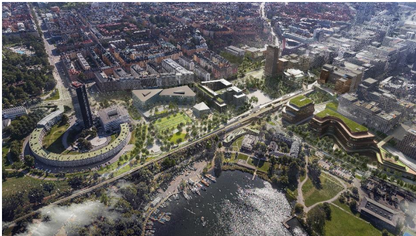
Visualisering av planförslaget, flygperspektiv ifrån nordost

I Norrtull korsas intensivt trafikerade gator med viktiga gång- och cykelstråk, samtidigt som Stockholms innerstad och dess utbyggnad här möter Nationalstadsparken med dess natur- och rekreativa värden. Integreringen av Norrtull i Hagastaden med en ny trafik- och stadsstruktur ger platsen en tydlig karaktär som knutpunkt och entréplats i Stockholms norra innerstad. Flytt av Uppsalavägen till ett västligare läge tillsammans med avsmalnande trafikrum för Uppsalavägen och Sveavägen ger plats för en stadsbebyggelse som både skyddar Nationalstadsparken mot buller och ger möjlighet till en lugnare stadsmiljö där kvalitativa gröna ytor kan tillskapas i mötet mellan stad och park.