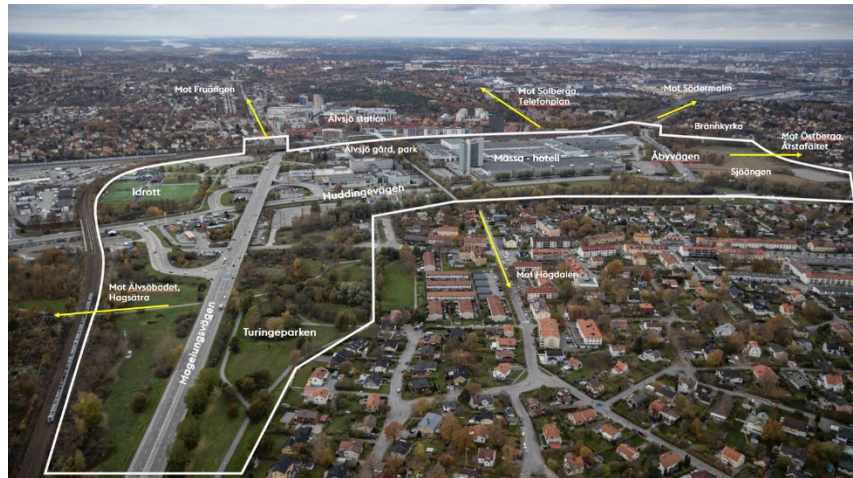
Figur 1: Programområdet (inom vit linje) och kopplingar till omgivande stadsdelar som ska stärkas

Området har med sin struktur, karaktär och sitt läge i staden speciella förutsättningar: