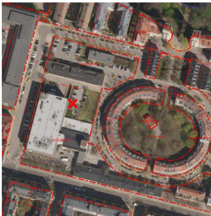
Fastigheten Tegelbruket 4 inom stadsdelen Kungsholmen

För området gäller en detaljplan enligt vilken fastigheten är avsedd för bostads- och vårdändamål, men som inte har genomförts.