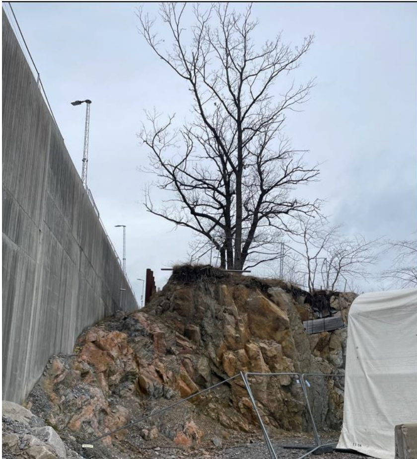
Bild, bevarade ekar i den planerade Terrassparken.