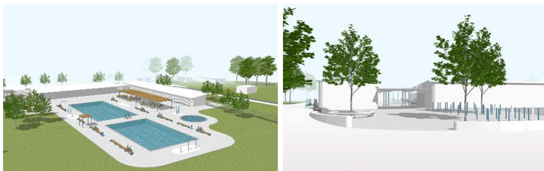
Illustrationer som visar flygvy över badområdet samt vy över entrézonen från Ormkärsvägen. (Källa: Nivå Land).

För att minimera kostnadsdrivande etappindelningar och provisoriska lösningar under byggtiden kommer badet att vara stängt under den period som entreprenad pågår, sommarsäsongen 2026.