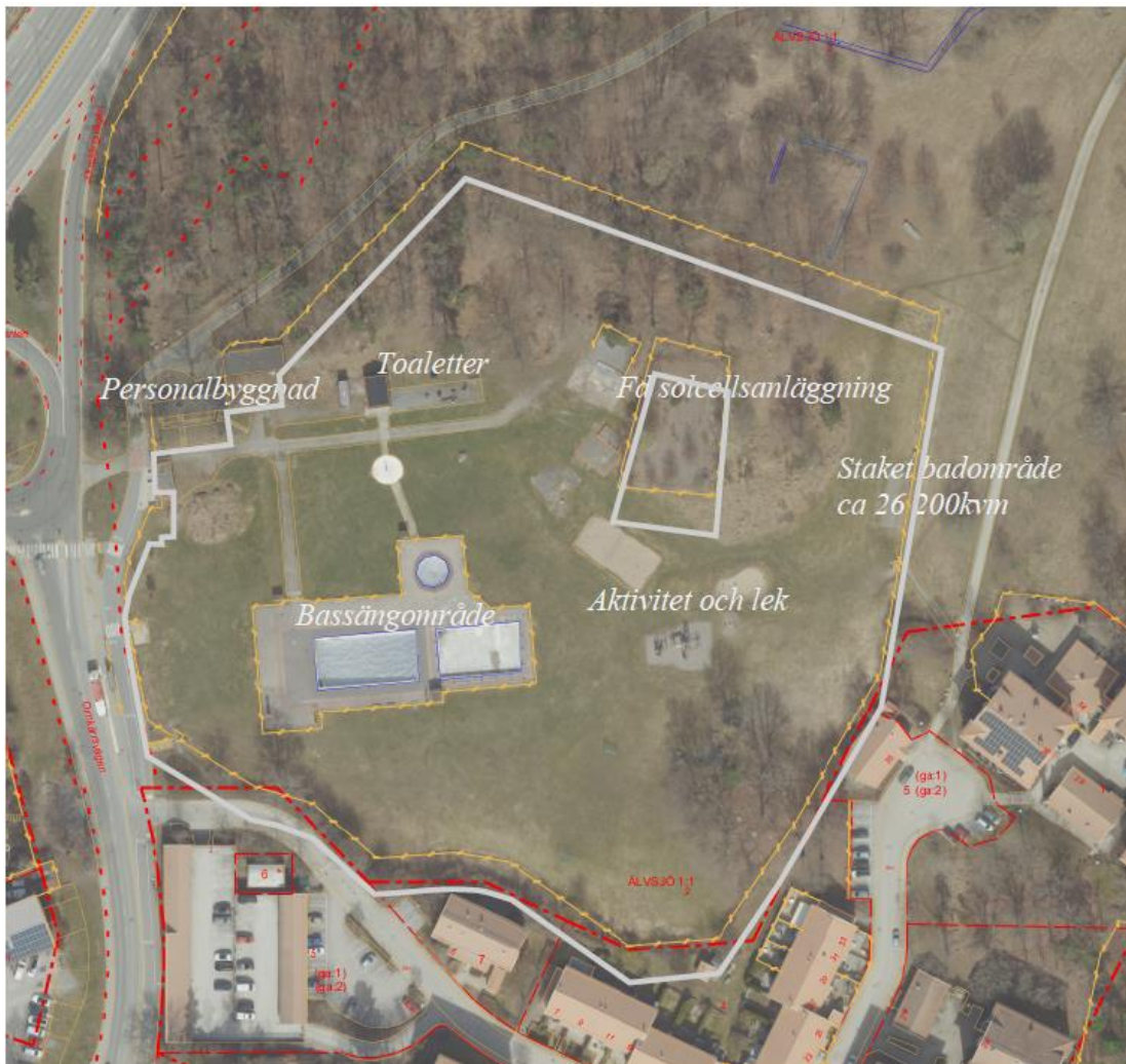
Flygfoto över Älvsjöbadet, utbredning samt befintlig anläggning.