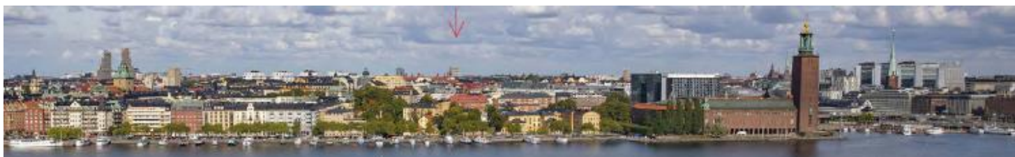
Vy från Skinnarviksberget på Södermalm. Planförslaget och dess påverkan på stadsbilden (röd pil). White White och Koponen Stenqvist, 2024

Efter samrådet bearbetades planförslaget av stadsbyggnadskontoret utifrån inkomna samrådyttranden och synpunkter. En del tekniska och logistiska frågor studerades vidare och tidigare föreslagen utformning bearbetades inför granskningen. Målet med bearbetningen var att byggnaden skulle anpassas mer till stadens siluett och stadsbilden med samma föreslagna byggnadshöjd.