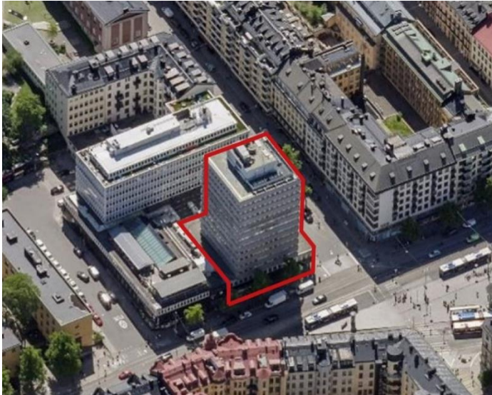
Röd linje markerar befintlig bebyggelse inom planområdet.