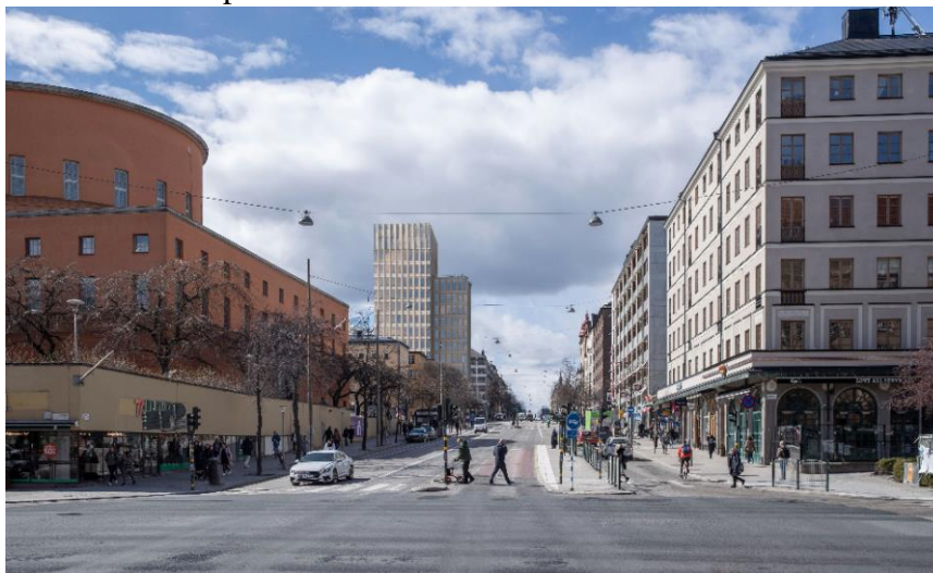
Volymstudie, planförslaget sett från nordöst/Odengatan (vypunkt 5). White och Koponen Stenqvist, 2024

Den högre delvolymen har placerats in mot kvarterets mitt. Syftet är att placeringen ska minimera skuggverkan och vara gynnsam för mikroklimatet för närliggande bebyggelse och allmän plats.