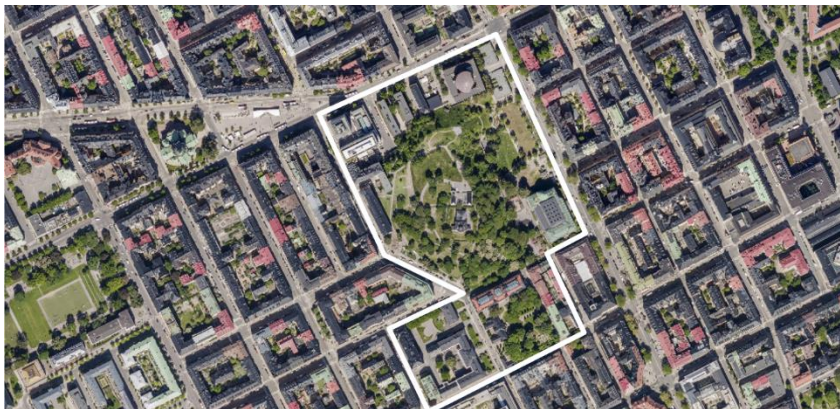
Flygfoto, värdekärna Stockholms gamla högskoleområde – omkring Observatorielunden markerad med vit linje.

I riksintresset ingår även enskilda miljöer, så kallade värdekärnor, som på olika sätt vittnar om stadens utveckling. Planområdet ligger inom värdekärnan för Stockholms gamla högskoleområde omkring Observatorielunden. I området ingår bland annat Stockholms Observatorium från 1750-talet samt den första Tekniska högskolan, Handelshögskolan och Stadsbiblioteket som är uppförda under 1920-talet.