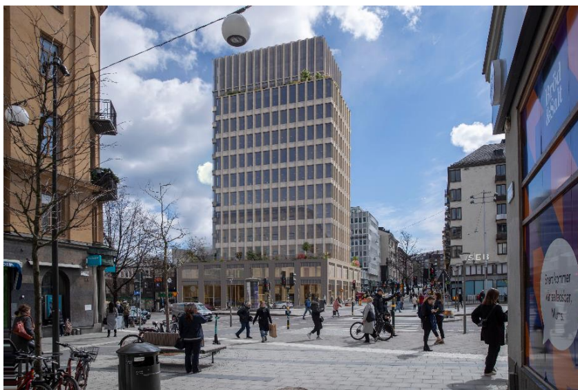
Volymstudie, planförslaget sett från norr/Norrtullsgatan (vypunkt 4). White och Koponen Stenqvist, 2024

Planförslaget innebär att en ny byggnad uppförs vid korsningen Odengatan/Norrtullsgatan, som ersättning för dagens läkarhus. Den nya byggnaden föreslås fortsatt utgöra ett landmärke vid Odenplan, en av stadens viktigaste infrastrukturnoder.