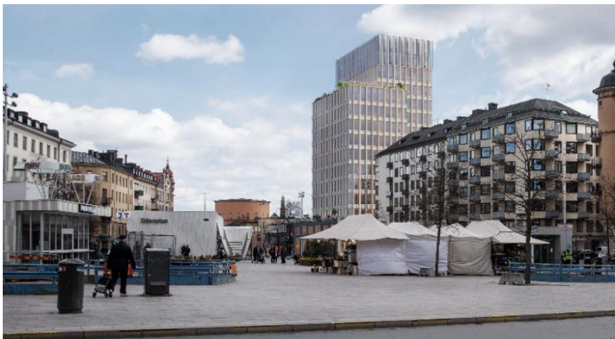
Volymstudie, planförslaget sett från Odenplan/Gustav Vasa kyrka (vypunkt 1). White och Koponen Stenqvist, 2024

För att öka upplevelsen av slankhet och vertikalitet har högdelen delats upp i två delvolymerna med olika höjder. Den lägre delen av dessa relaterar i höjd till det befintliga läkarhusets takfotshöjd. Den högre volymen är ca 11 meter högre än dagens hisstopphöjd.