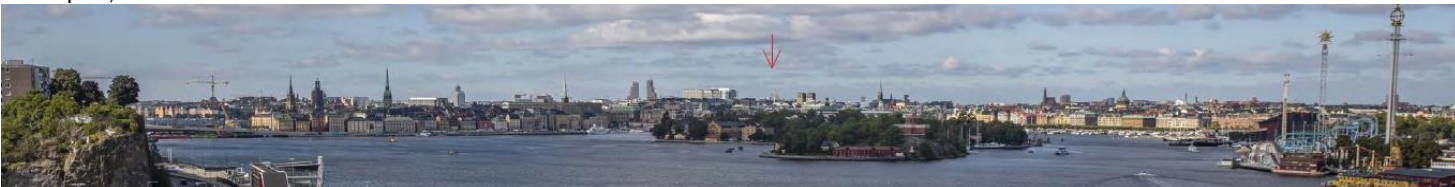
Vy från Fåfången på Södermalm. Planförslaget och dess påverkan på stadsbilden (röd pil). White White och Koponen Stenqvist, 2024

I yttrandena från granskningen kvarstod synpunkter från enstaka remissinstanser att byggnadskropparna behöver bli lägre. Det förekom även yttranden från remissinstanser som berörde tekniska och logistiska frågor i planförslaget. Länsstyrelsen yttrade sig endast gällande föreslagen dagvattenhantering i planförslaget.