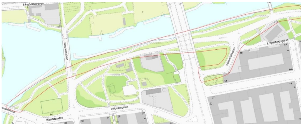
Figur 1. Avgränsning av utbreddningsområde, Söder Mälarstrand (Karta: Stockholm stad).

Hösten 2014 påbörjades arbete med en Systemhandling för projektet. Staden visste sedan tidigare att det varit problem med stabiliteten i området då rörelser i marken gjorde att trafiken fick stängas av i samband med utförandet av gång- och cykelbanan öster om Pålsundsbron. Med anledning härav inleddes en geoteknisk undersökning för att kunna bedöma stabiliteten för föreslagna breddningar och nya stödmurar.