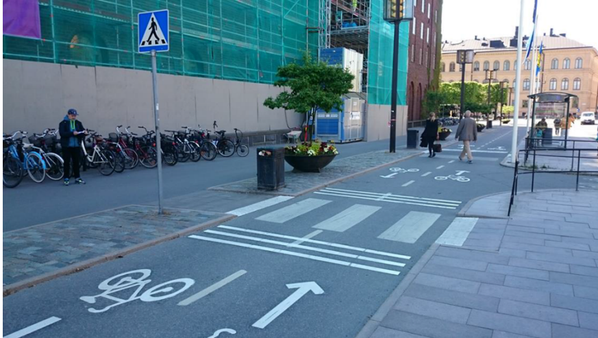
Stadshuset efter åtgärd.

Projektet visade att kollisioner mellan fotgängare och cyklister är ett relativt litet trafiksäkerhetsproblem, men att korsningspunkter mellan fotgängare och cyklister kan utgöra ett trygghets- och framkomlighetsproblem för såväl fotgängare som cyklister. Studierna visade också att det finns begränsade möjligheter att styra cyklister med de enkla åtgärder som studerades i projektet. Det krävs även arbete med övergripande planering, cykelkultur och attityder.