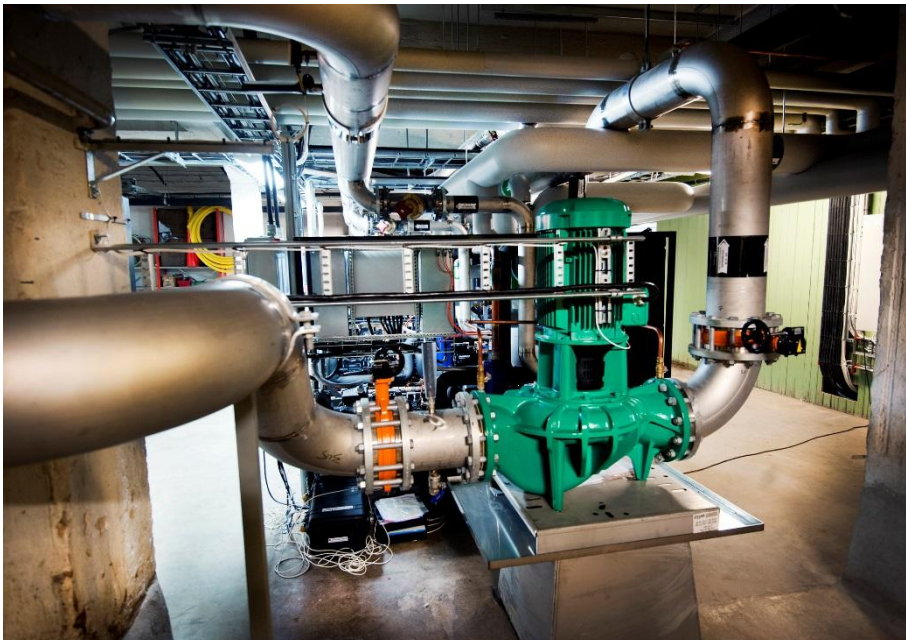
Figur 2 Stockholms stads anläggning i Slakthusområdet. För att återvinna spillvärmerna från Kylhuset till fjärrvärmenätet har Fastighetskontoret installerat i tre seriekopplade värmepumpar som höjer temperaturen på spillvärmerna i tre steg. Anläggningen värmer upp returvattnet och levererar ut det på fjärrvärmenätet vid en temperatur upp till 72 °C.

Enligt beslut kommer Slakthusområdets verksamhet att flyttas till Larsboda i Farsta och företagarna kommer att erbjudas moderna och ändamålsenliga lokaler anpassade för livsmedelsproduktion. I samband med flytten kommer Öppen Fjärrvärmes befintliga anläggning att tas ur bruk. De nya lokalerna byggs med höga krav för att uppnå stadens klimatmål och ambitionen är att de ska miljöcertifieras. Det innebär att mängden spillvärme från livsmedelskyla inte kommer att bli lika stor. Man räknar dock med att området i genomsnitt över året kommer att ha ett värmeöverskott motsvarande 1 MW värmeeffekt. Även om man i första hand använder lokal värmeåtervinning, kommer man att vara tvungna att ha någon ytterligare lösning för att ta hand om den överskjutande spillvärmerna och där utreds Öppen Fjärrvärme som ett av alternativen.