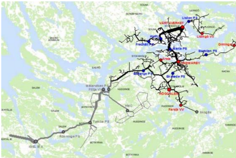
Figur 3 Exempel på sammankopplade fjärrvärmenätet i Stockholmsområdet.

Eftersom leverantören betalar eventuell ledningsdragning 12 från fjärrvärmenätet in i byggnaden, är det mycket lättare att få ekonomisk lönsamhet om avståndet till fjärrvärmenätet är kort.