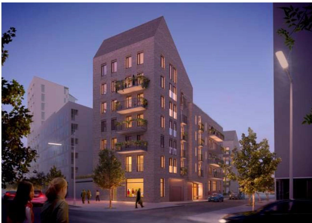
Valla södra, föreslagen ny bebyggelse. Vy sett från sydväst.