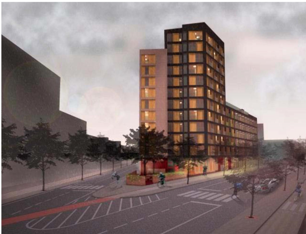
Valla södra, föreslagen ny bebyggelse. Vy sett från nordost, med studenthusets högdelen i förgrunden.