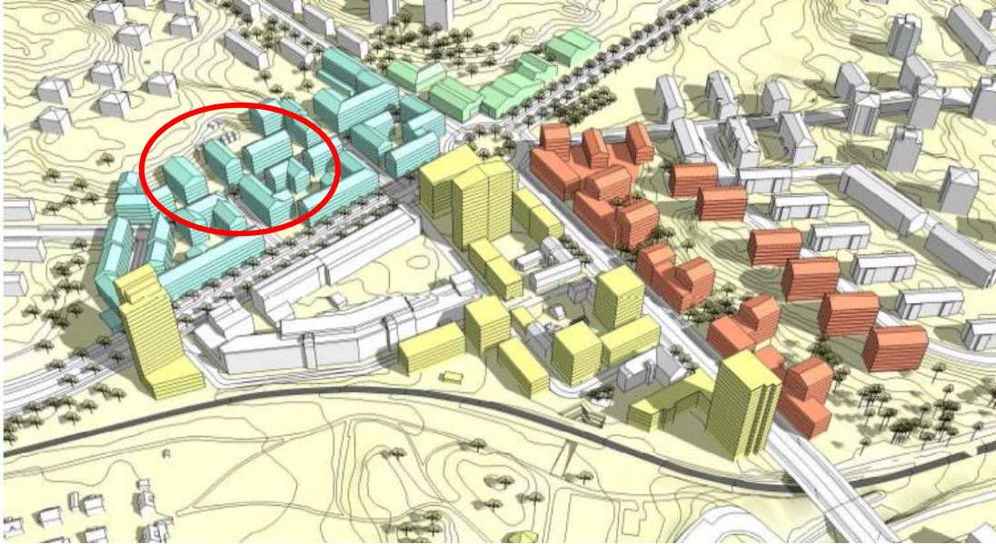
2015 Strukturplan Årstastråket 3. Stockholmskems tomträtt i Allgunnen inringad med rött.

Detaljplaneförslaget för Allgunnen har varit på samråd 9/5-20/6 2018.