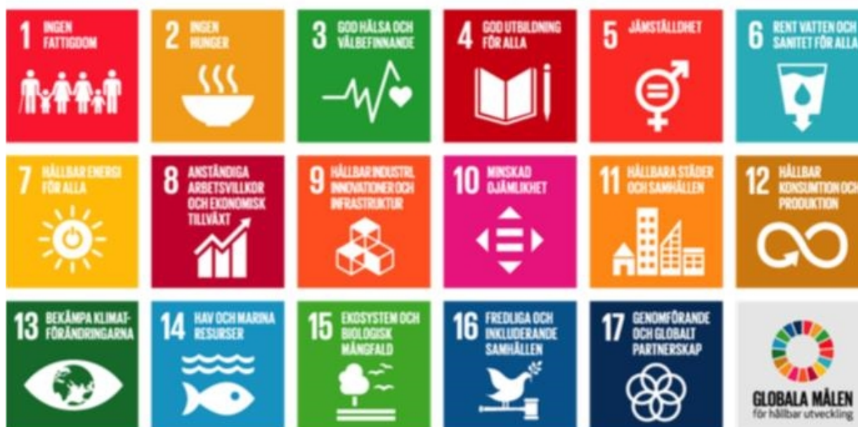
Figur 3 — De 17 globala hållbarhetsmålen 6

Anm.: Vill du läsa mer om de globala hållbarhetsmålen se www.globalamalen.se