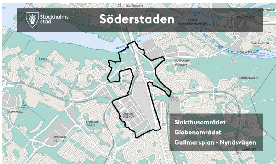
Söderstadens geografiska avgränsning.

Nynäsvägen, se bild nedan. Dock kvarstår inriktningen att koppla samman Söder och Södermalm.