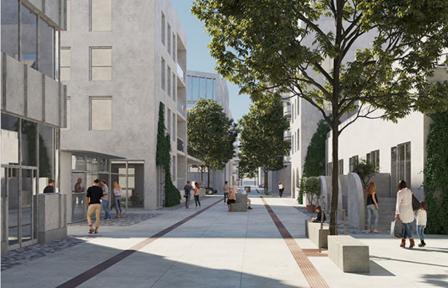
Visionsbild för Livdjursgatans förlängning.

Etapp 1 omfattar cirka 900 nya bostäder, en idrottshall, en grundskola (F-9), tre förskolor och lokaler för kontor, handel och service. I de befintliga byggnaderna runt den utökade parken "Fällan" planeras lokaler för kontor, handel och restauranger.