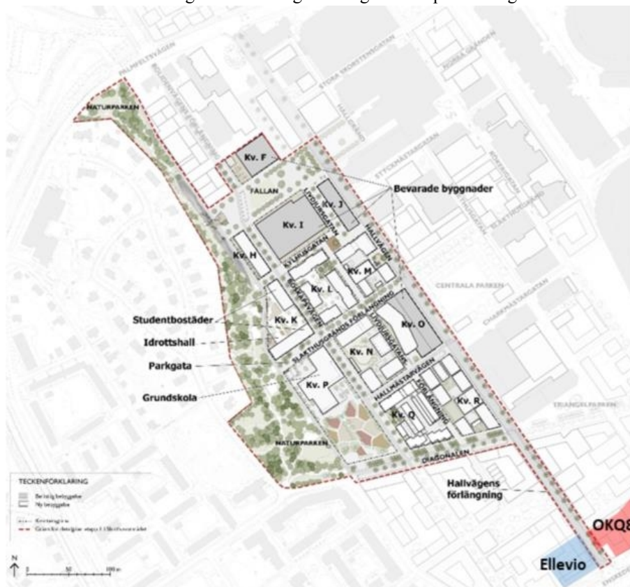
Planområdet för etapp 1 med kvartersbenämningar. Tolv kvarter ingår i detaljplanen, de gråmarkerade byggnaderna ska bevaras och byggas om för nya ändamål. Ellevios tomträtt markeras i blått och OKQ8:s i rött.

Fem fastigheter inom planområdet är upplåtna med tomträtt. Tre av dessa, Kylhuset 16, 22 och 27, kv F-I-J i kartan, är upplåta till Atrium Ljungberg AB som ska utveckla fastigheterna till kontor och lokaler för centrumändamål. Två tomträter, Isterbandet 5, upplåten till Ellevio AB och Skinkan 2, upplåten till OKQ8 AB, påverkas av Hallvägens förlängning i södra delen av planområdet mot Enskedevägen. Kontoret förhandlar med bolagen om mindre fastighetsregleringar för att säkerställa att Hallvägen kan förlängas i enlighet med planförslaget.