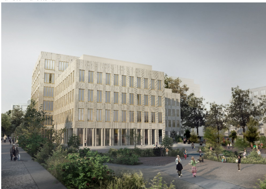
Ny grundskola i Slakthusområdet. Bild: Max Arkitekter.

I de bevarade byggnaderna föreslås centrumverksamheter, kontor och skoländamål. En ny kontorsbyggnad kommer att byggas som en integrerad tillbyggnad av en bevarad magasinbyggnad. Förslaget innehåller även en grundskola (F-9) för 900 elever och en fullstor idrottshall.