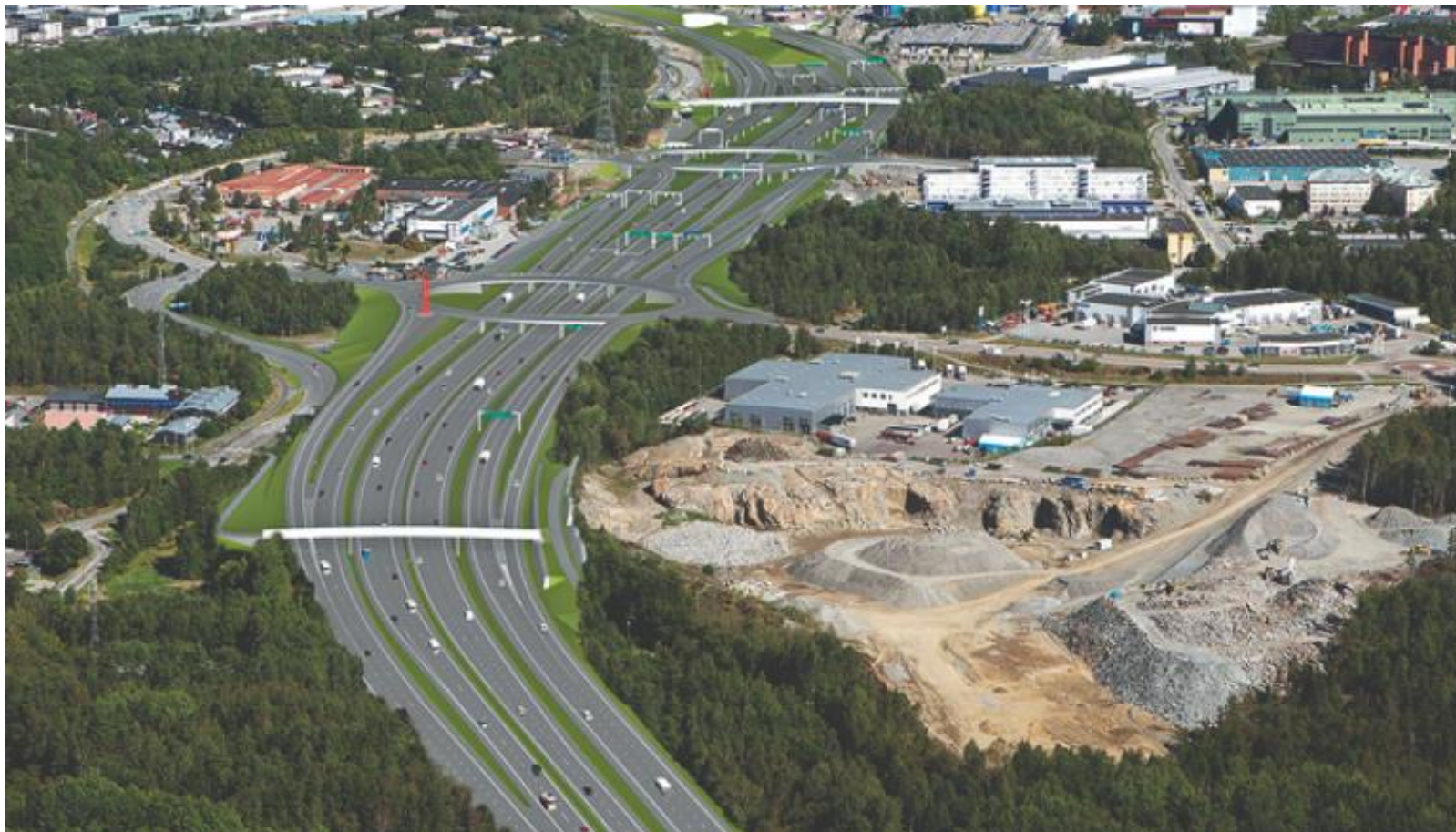
Illustration färdig utformning delprojekt Kungens Kurva. Vy söderifrån.