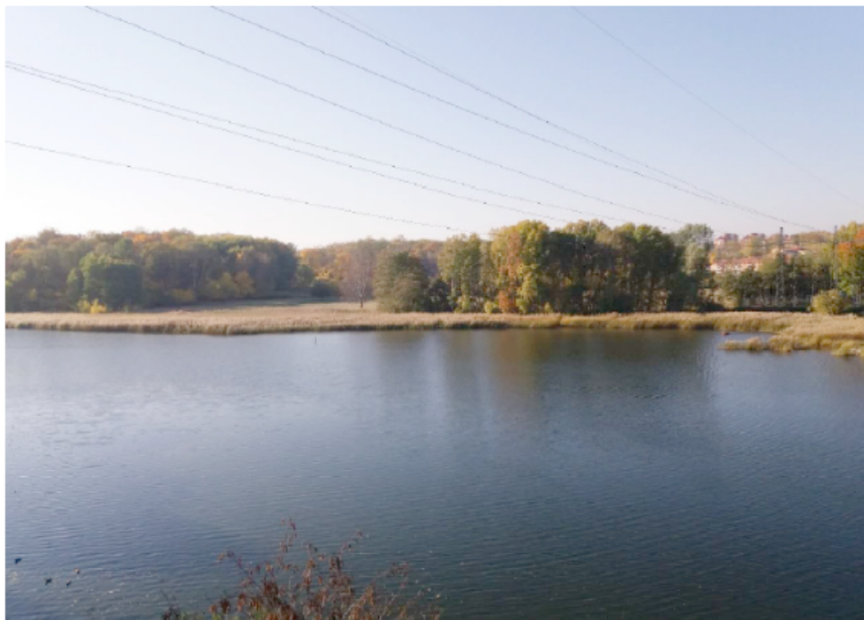
Befintlig luftledning över Brunnsviken februari 2020.

Ansökan kompletterades aldrig utan istället valde Ellevio att dra tillbaka ansökan. Anledningen till det är att Ellevio, efter genomförd detaljprojektering med ytterligare utredningar och kostnadsberäkningar under 2019, har konstaterat att den ansökta lösningen inte är lämplig. Det beror dels på stor påverkan på naturmiljön till följd av avverkning av ett större antal träd än tidigare förutsatt antal träd inom Nationalstadsparken och höga kostnader till följd av tekniskt komplicerade lösningar. Därtill har ägandeskapet av gång- och strukturbron, som skulle gå över Ålkistan och förbinda Solna och Stockholm och där markkablarna skulle byggas in inte lösts, vilket var en förutsättning för sträckningens genomförande.