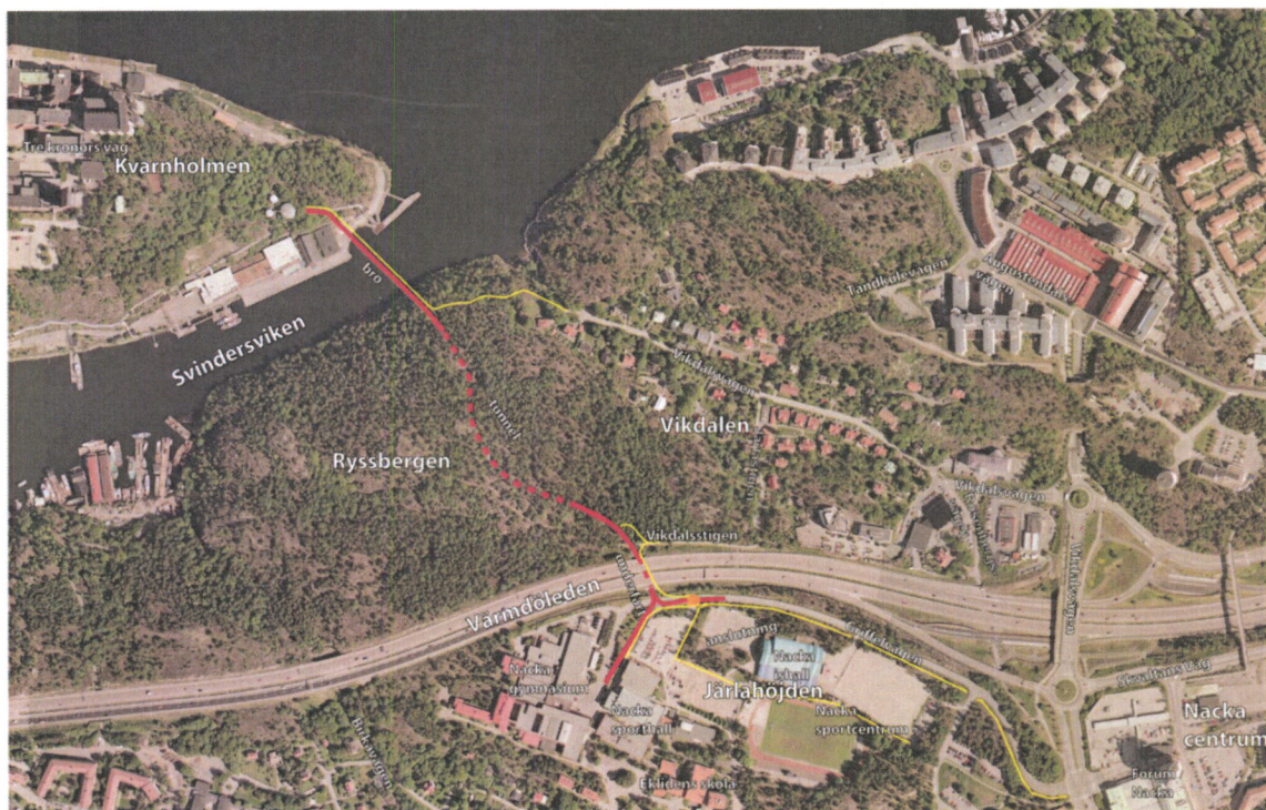
Figur 1: Kvarnholmsförbindelsen markerad i rött

Kvarnholmsförbindelsen etapp 2 är under projektering och innebär anslutning till Värmdöleden. Det är etapp 1 som samverkansavtalet berör.