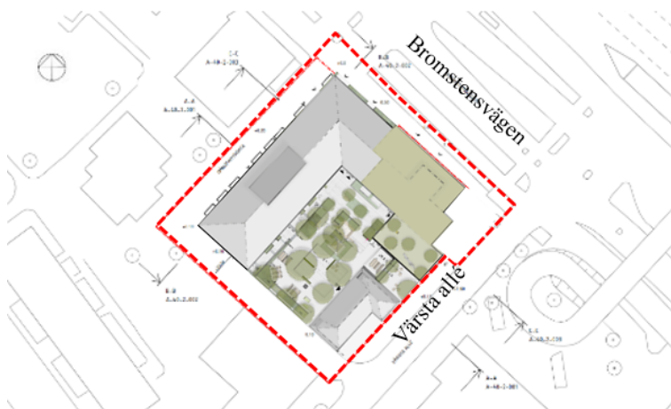
Illustrationsplan över planområdet (Arkitema Arkitekter).

Planförslaget innebär att ett bostads- och centrumkvarter ersätter befintliga parkeringsytan och del av byggnaden för Spånga järn- och färghandel inom kvarteret Hedvig 7. Utgångspunkterna i planarbetet har varit att den nya bebyggelsen formar en kvartersstruktur där den äldsta delen av Spånga järn- och färghandel ingår.