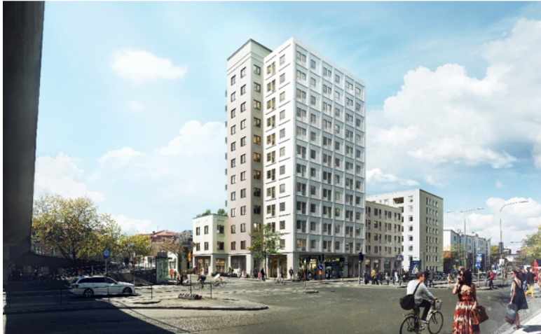
Vy från Bromstensvägen (Arkitema Arkitekter). Bilden illustrerar en möjlig utformning av kvarteret.

I den nybyggda delen av kvarteret möjliggör detaljplanen sammanlagt cirka 8200 kvm ljus BTA varav cirka 300 kvm lokaler för centrumändamål. Det nya halvslutna kvarteret bedöms sammanlagt kunna inrymma cirka 150 lägenheter samt sex LSS-lägenheter. Planen möjliggör även en bostadsgård om cirka 600 kvm och ett garage i en del av kvarterets bottenvåning innehållande 29 parkeringsplatser varav en handikapparkering. En mindre platsbildning vid korsningen Bromstensvägen/Värsta allé är planerad för att underlätta gångflöden förbi planområdet till och från pendeltågsstationen.