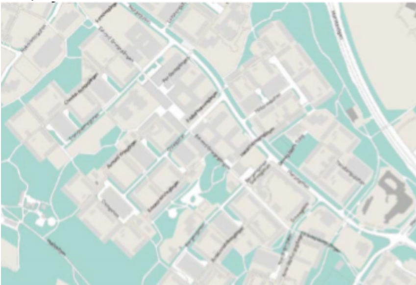
Karta över Husby.