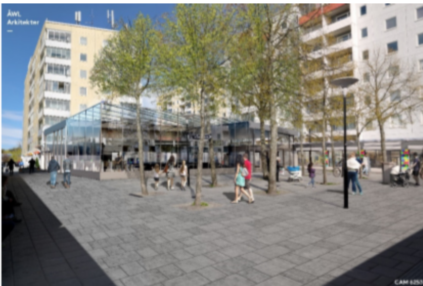
Förslag på inglasning av tunnelbaneuppgång och intilliggande handel på torget.

Svenska Bostäder har även träffat ett intentionsavtal med SL om att bygga ut tunnelbaneuppgången i nordvästra delen av Husby centrum. Avtalet innebär att tunnelbaneuppgången inglasas och att en del av den intilliggande torgytan tas i anspråk för handelsändamål med syfte att öka tryggheten i området.