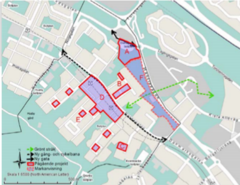
Kartan illustrerar pågående projekt i Husby samt markanvisning av del av Akalla 4:1 (område F), se även bilaga 1.

Utvecklingsförslaget möjliggör för Hanstavägen att utvecklas till en stadsgata med bostadshus på gatans båda sidor och där entréerna vänds mot gatan.