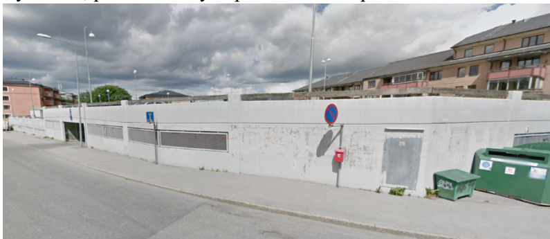
Befintligt parkeringsdäck som rivs för att möjliggöra projektet

Parkering för blivande hyresgäster kommer förläggas i garage inom bostadskvarteret. Projektet planerar också för mobilitetsåtgärder, som till exempel cykelrum, plats för lådcykelpool och för bilpool.