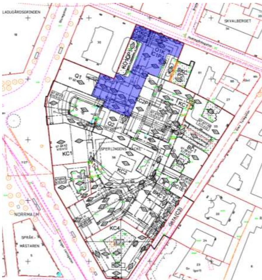
Bilden visar detaljplanekartan för Del av kvarteret Sperlingens backe med byggnaden på Humlegårdsgatan 17 markerad med blått.