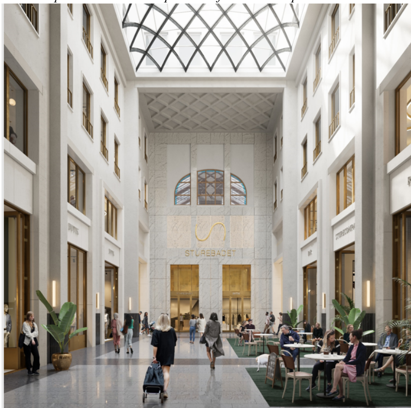
I den nya gallerian är högresta dagsljusbelysta rum kompositionens stomme. Perspektiv från över entrérummet från Humlegårdsgatan, med Sturebadet i fonden.

Ett bevarande av byggnaden på Humlegårdsgatan 17 innebär begränsade möjligheter till ombyggnad och ändrad användning. Det är inte heller möjligt att skapa en entré med en tydlig och offentlig karaktär mot Humlegårdsgatan. Kvarterets koppling till den omkringliggande staden försvagas därmed.