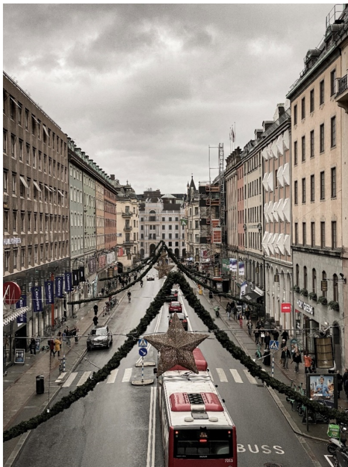
Perspektiv från Regeringsgatans bro mot Stureplan med Bångska palatsets rekonstruerade fasad i fonden på Kungsgatan. Byggnad på Humlegårdsgatan 17 bevarad samt den högsta byggrätten på Freys Hyrverk sänkt.