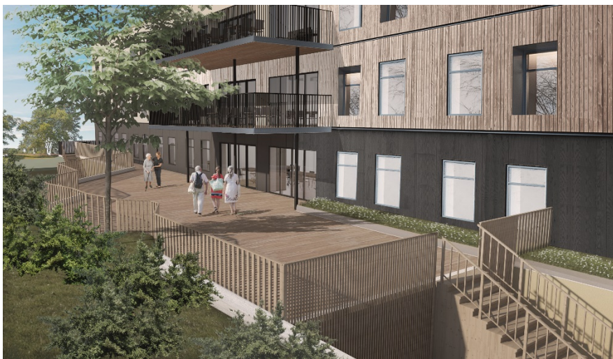
Uteplatsen till det nyligen uppförda vård- och omsorgsboendet. Bild: Liljewall arkitekter

Bilderna som följer visar hur den tillkommande bebyggelsen är möjlig att utföra och gestalta inom ramen för vad detaljplanen tillåter. Även andra sätt att gestalta bebyggelsen kan vara möjliga.