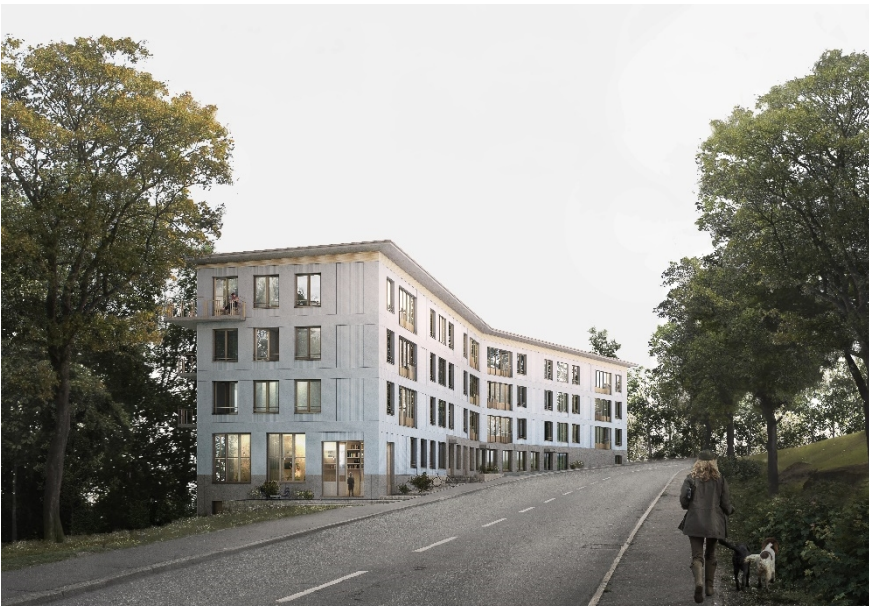
Flerbostadshus vid Ullerudsbacken. Bild: Jägnefält Milton