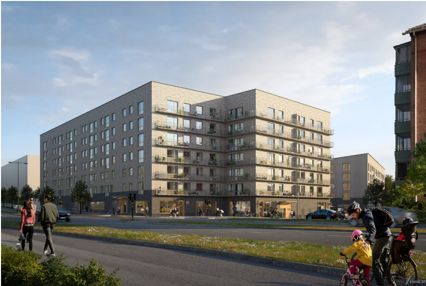
Flerbostadshus vid korsningen mellan Magelungsvägen och Ullerudsbacken. Byggnaden föreslås ha en eller flera lokaler för centrumändamål i bottenvåningen.