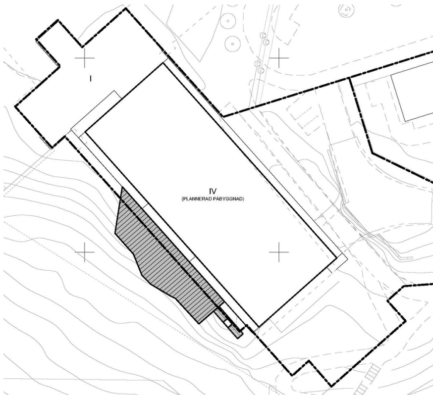
Illustration som visar det nyligen uppförda vård- och omsorgsboendet och föreslagna uteplats (i mörkgrått). Bild: Liljewall arkitekter