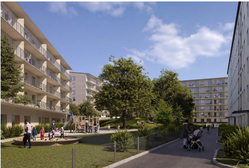
Den föreslagna förskolegården samt tillkommande flerbostadshus. Till höger skymtar ett befintligt bostadshus. Bild: TMRW/ON arkitekter