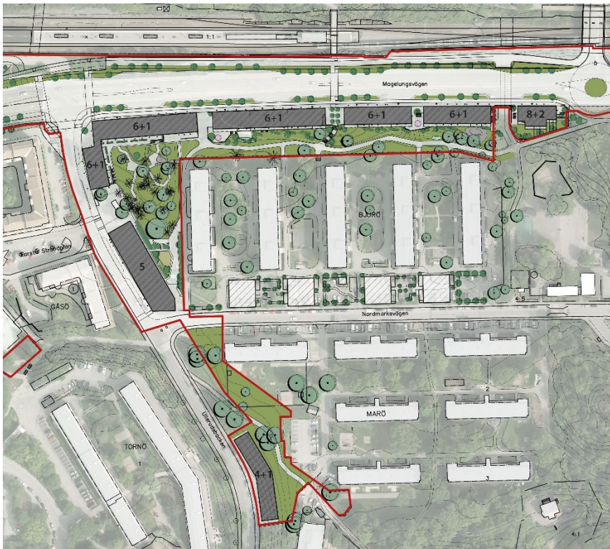
Illustration av tillkommande bostadshus med antal våningar. Första siffran betecknar hela våningar. Andra siffran betecknar våningar i suterräng. Röd linje markerar plangräns. Bild: Landskapslaget