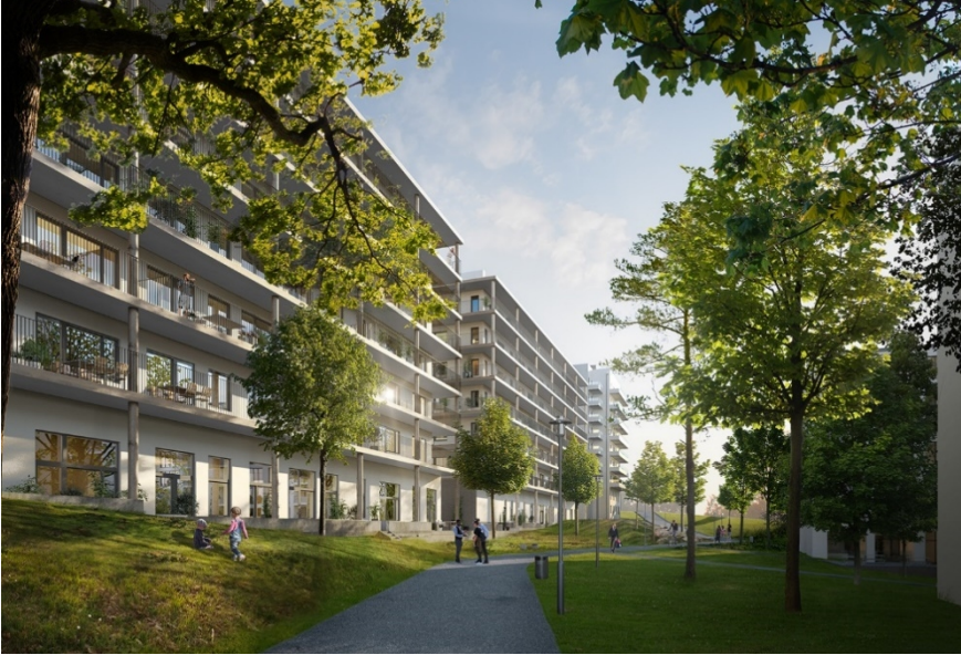
Gårdssidan av flerbostadshus längs med Magelungsvägen. Vy mot öster. Till höger skymtar befintlig bebyggelse.