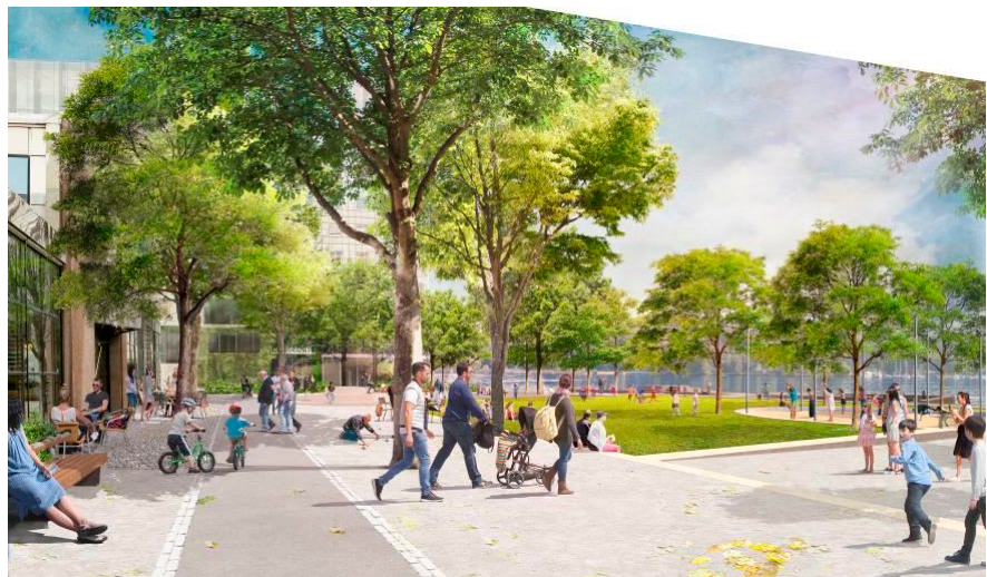
Illustration av parken mellan M19 och kajstråket.

Parken M19 är Marieviks gröna mittpunkt med en yta på cirka 2900 kvadratmeter. Parken har ett kulturhistoriskt värde men har idag en begränsad användbarhet och behöver kompletteras med fler funktioner och sociala värden. Här ska finnas utrymme för olika slags aktiviteter. Parkens nuvarande formella formspråk behålls delvis men öppnas upp mer för att få tillgängliga ytor. Hela parken har sol på förmiddagen vid höst-/vårdagjämning och är solbelyst hela dagen sommartid.