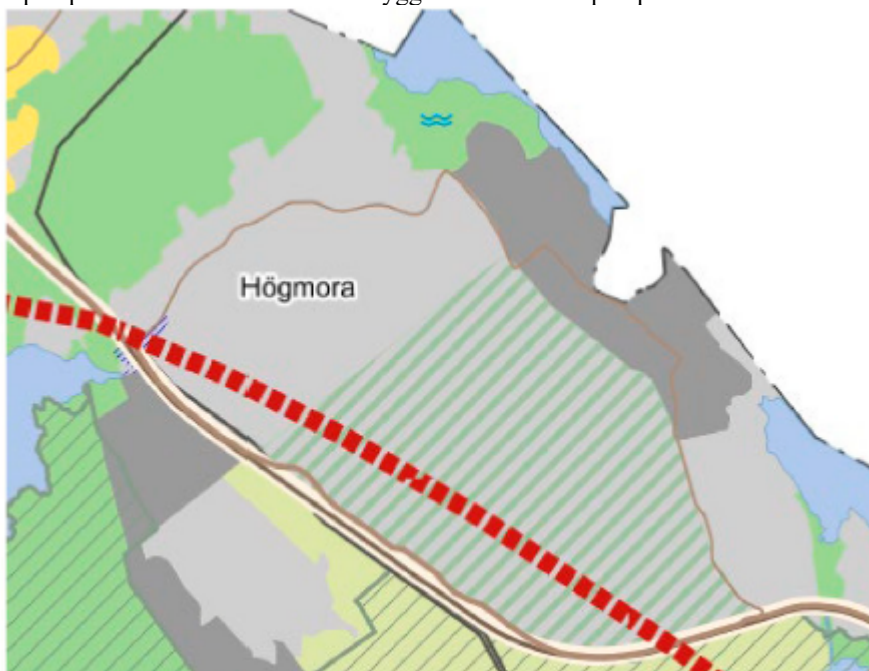
Figur 2. Streckat område med grå bakgrund är det område som är markerat som bebyggelseserv i samrådsförslaget. Kommungränsen till Stockholm och delar av Magelungen i nordost.

Stockholms stad är stora markägare för det område i Högmora som är markerat som bebyggelseserv i samrådsförslaget, se figur 2. Kontoret ser positivt på en stadsutveckling i Högmora, det skulle bidra till bostadsförsörjningen i regionen. En stadsutveckling är förenlig med att bevara den regionala grönstrukturen, som beskrivs i samrådsförslaget, då kopplingen vid Kynäsberget och vidare till Stockholm bedöms ha störst naturvärden. Kontoret instämmer i vikten av bra busskollektivtrafik till området vid en stadsutveckling. Då Huddinge kommuns översiktsplan tar sikte på 2050 anser kontoret att stadsutveckling på denna fastighet bör ligga inom planperioden och inte som en bebyggelseserv efter planperioden.