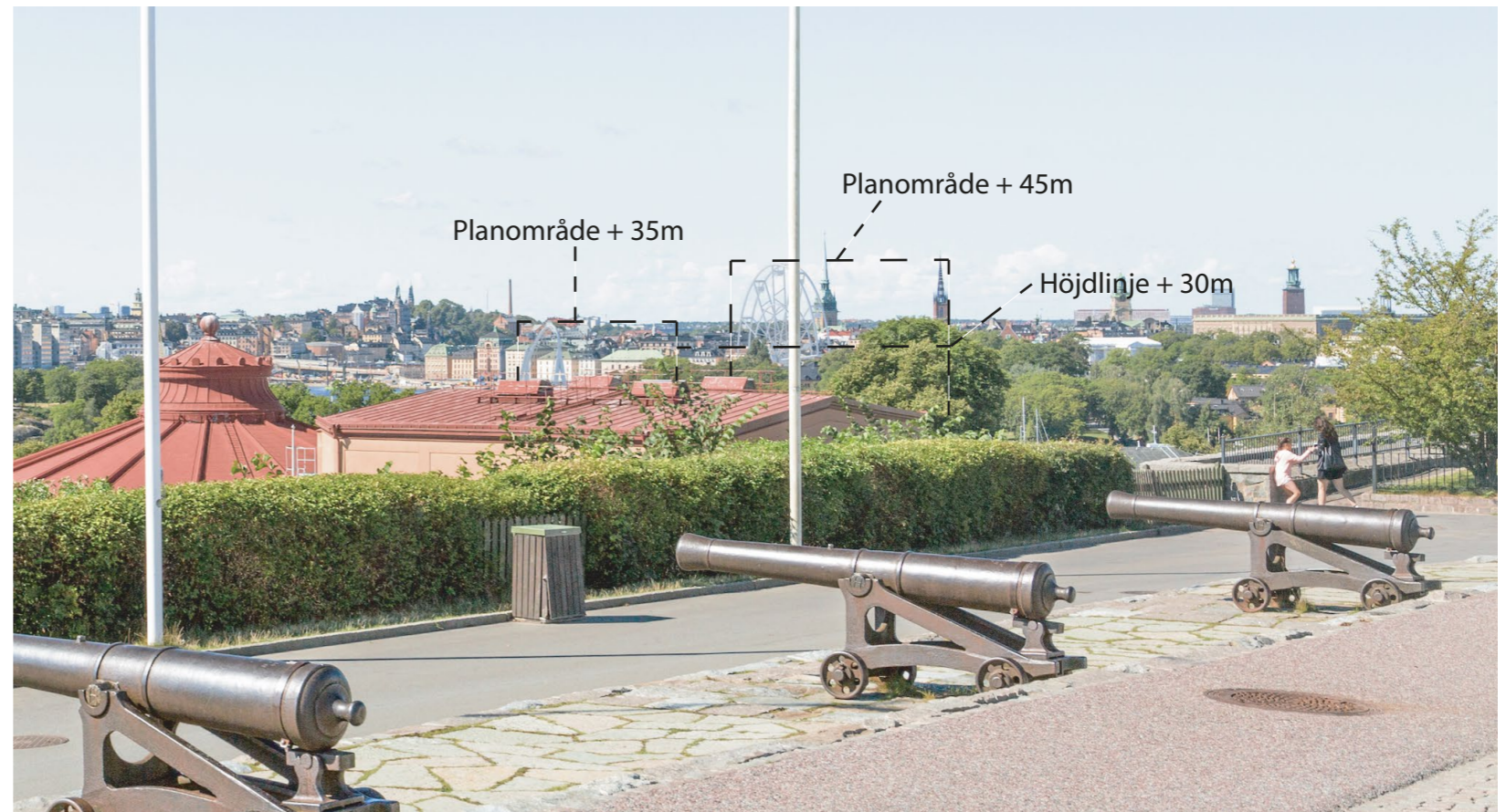
Tänkbar vy från Solliden

Detta har ej beaktats i det bildmaterial som syns i media då det refererar till befintliga attraktioners höjder som är mätta från marknivå till dess topp.