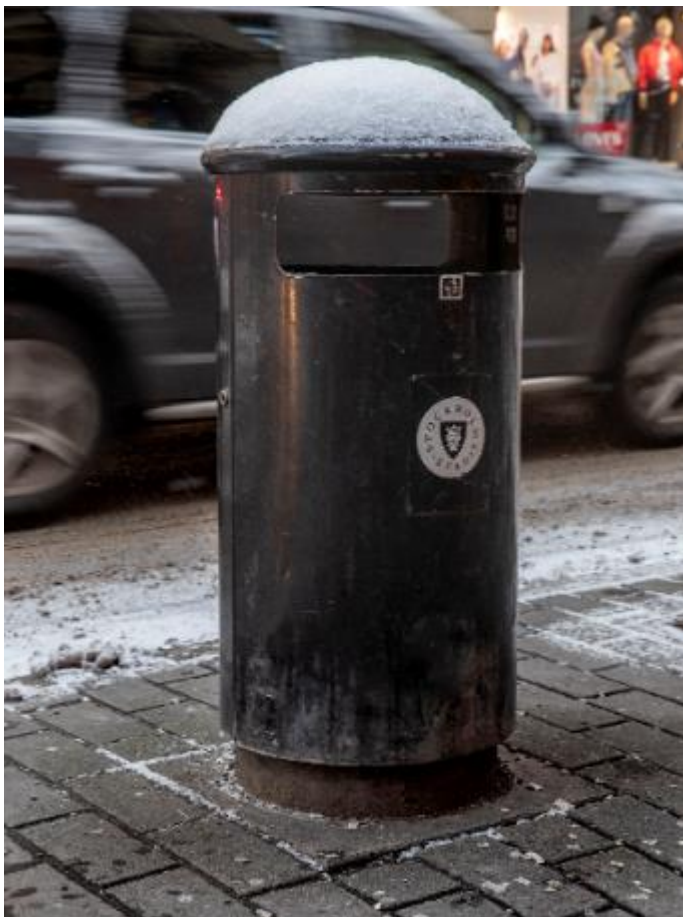
En av stadens ca 12000 skräpkorgar

Förutom renhållning och städning innebär det tömning av stadens cirka 12 000 avfallskorgar, där avfallet normalt är osorterat och går till förbränning.