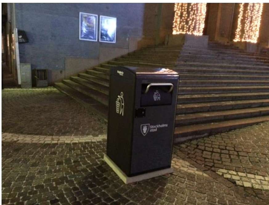
Komprimerande sopkärl som drivs av egengenererad solcellsel

Komprimering av avfallet och tömning då kärlet är fullt kan leda till färre transporter om det kombineras med anpassning av arbetsätt och tömningsfrekvenser. Eftersom kärlet är stängt minskar också risken för att fåglar och andra skadedjur kommer åt avfallet vilket minskar risken för nedskräpning. Kontoret har för avsikt att ansöka om klimatinvesteringsmedel för att finansiera kommande investeringar i komprimerande sopkärl.