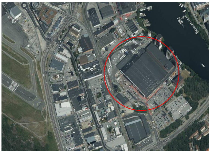
Snedbild med det f.d. storbryggeriet på Gjutmästaren 6 markerat med röd cirkel.

Bebyggelsestrukturen i området är splittrad med en svag relation till både omgivande gator och vattenrummet. Byggnaderna utgör solitärer, som utgår från verksamheternas funktioner och marken domineras av hårdgjorda ytor och stängsel. Kollektivtrafikläget till området är bra med stombussar och tvärbanan intill fastighetsgräns, vilket innebär närhet till tvärbanans Kista- och Solnagrenar, liksom tunnelbana och pendeltåg i Sundbyberg och Solna.