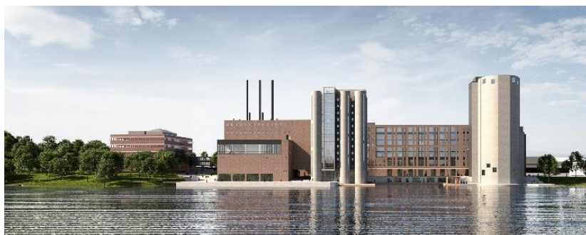
Kontorsparken och bebyggelsevolymerna mot Bällstaviken bevaras.

En utveckling av området möjliggör ett bevarande av det före detta bryggeriet som fysisk form i stället för att delar måste rivas på sikt, exempelvis som en följd av bristande underhåll. Detaljplanen säkrar att det tidigare bryggeriet kan leva vidare både som symbol och stadsbyggnadselement. Kulturhistoriskt värde och känslighet för förändring har vägts mot andra samhällsintressen, till exempel funktionskrav och fastighetsekonomi. Detaljplanen innebär en måttfull utveckling och möjlighet till återbruk av merparten av det gamla bryggeriets kulturhistoriskt värdefulla yttre och inre delar.