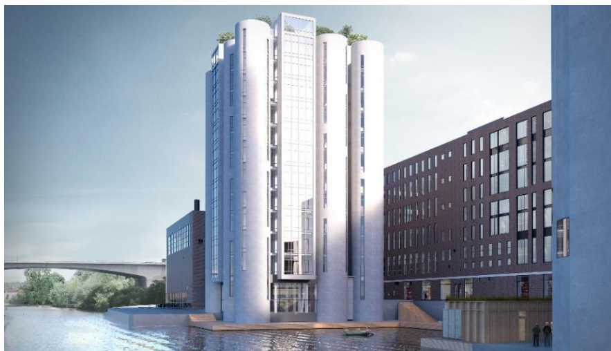
Vid Bällstaviken möjliggörs ett gångstråk, nya bryggor och exempelvis en bastu.

stadsbildsmässiga värden bevaras. Även utjämningsmagasinets grundkonstruktion avses bevaras som en sittplats i den norra delen, men själva byggnaden rivs (hus 18). Den centrala rumsligheten med park och den södra entréplatsen vid det f.d. bryggeriets huvudkontor och dubbla axlar från vattnet bevaras och förtydligas (S.E vid hus 12), liksom kopplingarna till kajstråket och kontorsparken (K). Platsen öppnas upp när senare byggda delar i norr rivs (hus 21, 22) för att förstärka det f.d. bryggeriet som Bällsta Hamns stadsbildsmässigt och kulturhistoriskt viktigaste motiv. Därmed även områdets orienterbarhet vid idrottscentrets norra entréplats (N.E).