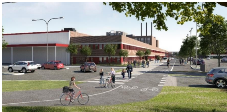
Nya gång- och cykelstråk fastställs från tvärbanan till idrottscentrets entréer.

Detaljplanen bedöms uppfylla stadens riktlinjer avseende tillgänglig angöring och parkering samt de nationella riktlinjerna för lutning på gångvägar och cykelbanor. Vid rampen mellan huvudbyggnaden och kontorshuset, där det finns en stor nivåskillnad med befintliga entréer blir det svårt att klara tillgängligheten. Orienterbarheten och viktiga samband förstärks genom att avskärmande bebyggelse rivs samtidigt som nya trädader och siktlinjer tillskapas vid gångstråken.