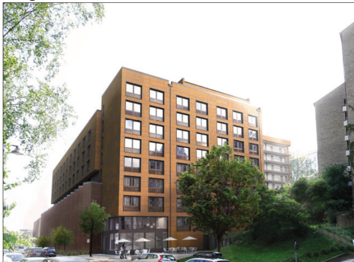
Vy mot öst längs Sankt Göransgatan och påbyggnad på befintlig byggnad (Bild: Brunnberg & Forshed)