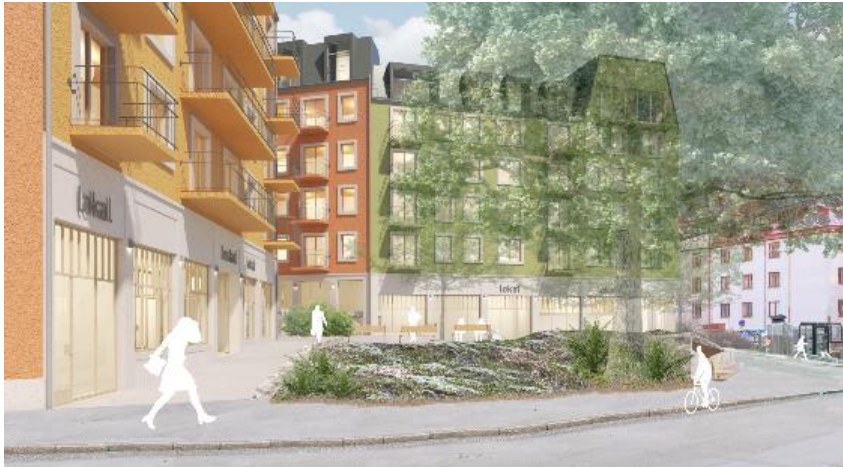
Vy över det planerade torget, mot öster. Bild: DinellJohansson och Belatchew Arkitekter