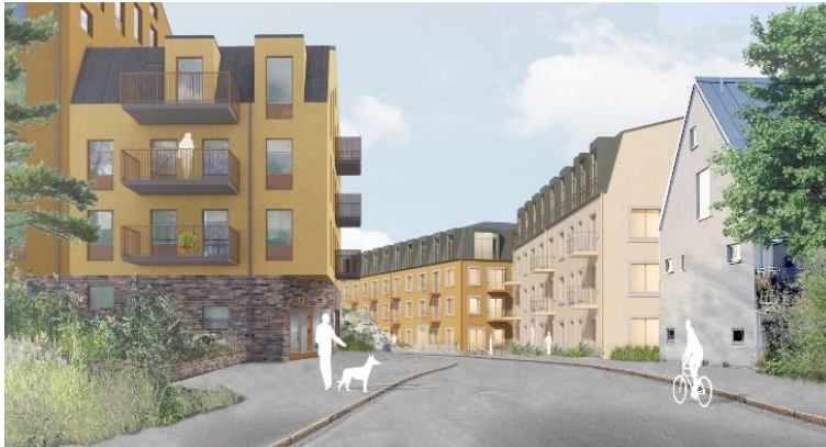
Den nya angringsgatan sedd mot öster. Bild: DinellJohansson och Belatchew Arkitekter