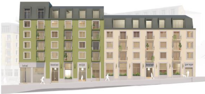
Exempel på sektionsvis färgsättning. Bild: DinellJohansson