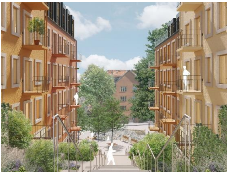
Trappstråket mot torget. Bild: DinellJohansson och Belatchew Arkitekter