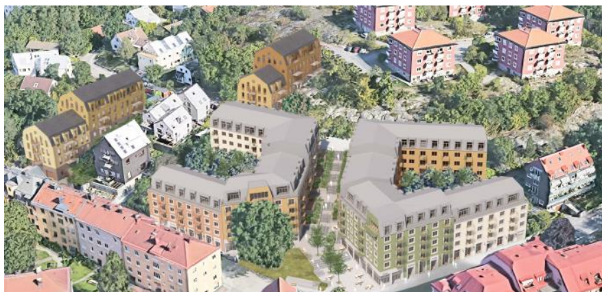
Planförslaget från söder. Illustration DinellJohansson och Belatchew Arkitekter.