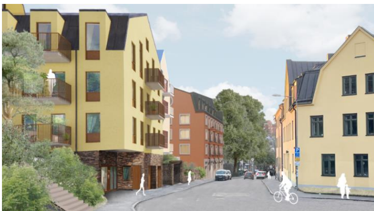
Erik Segersälls väg sedd mot öster. Bild: DinellJohansson och Belatchew Arkitekter