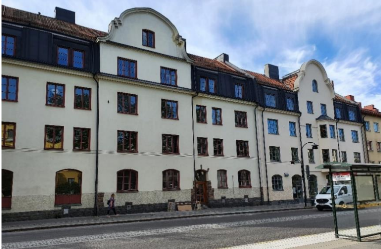
Äldre bebyggelse utmed Hägerstensvägen med karaktäristiska frontespiser och branta takfall.

Aspudden växte fram under 1900-talets början i linje med den tidens rådande stadsplaneideal, där fokus låg på att följa det naturliga landskapet. Aspudden har karaktär av tät stenstad i de äldsta, mest centrala delarna. Stenstadskaraktären är mycket påtaglig och identitetskapande.