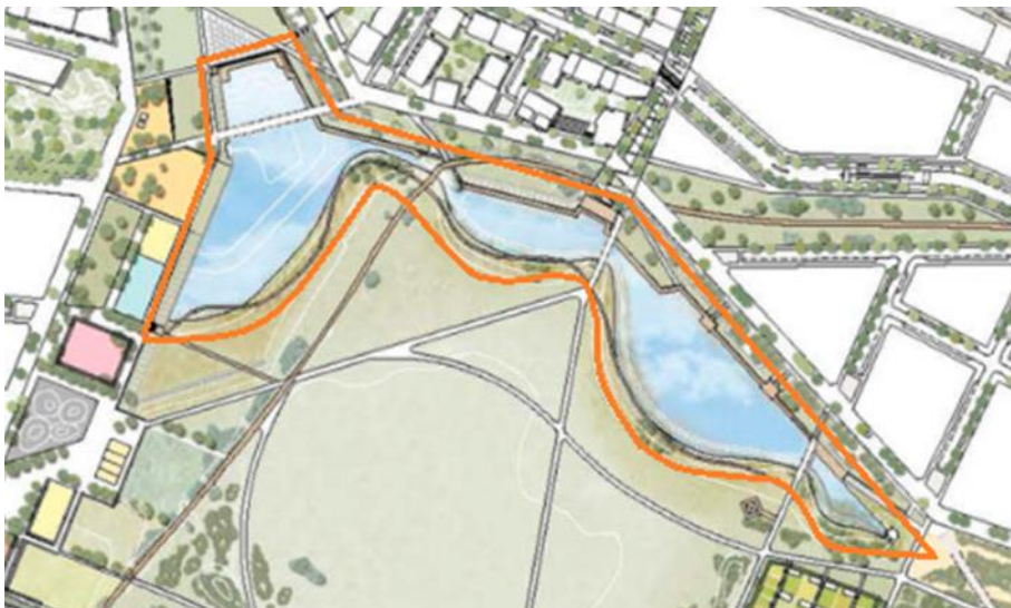
Figur 2. Bild över dagvattendammen, orangemarkerat.

Sammanfattningsvis har den anlagda dagvattendammen som syfte att fördröja nederbörd och avlasta dagvattensystemet. Vid kraftig nederbörd fungerar dammen som ett dagvattenmagasin för att fördröja och minska risken för översvämningar. Den beräknade kostnaden för dammen uppgår till 135 miljoner kronor.