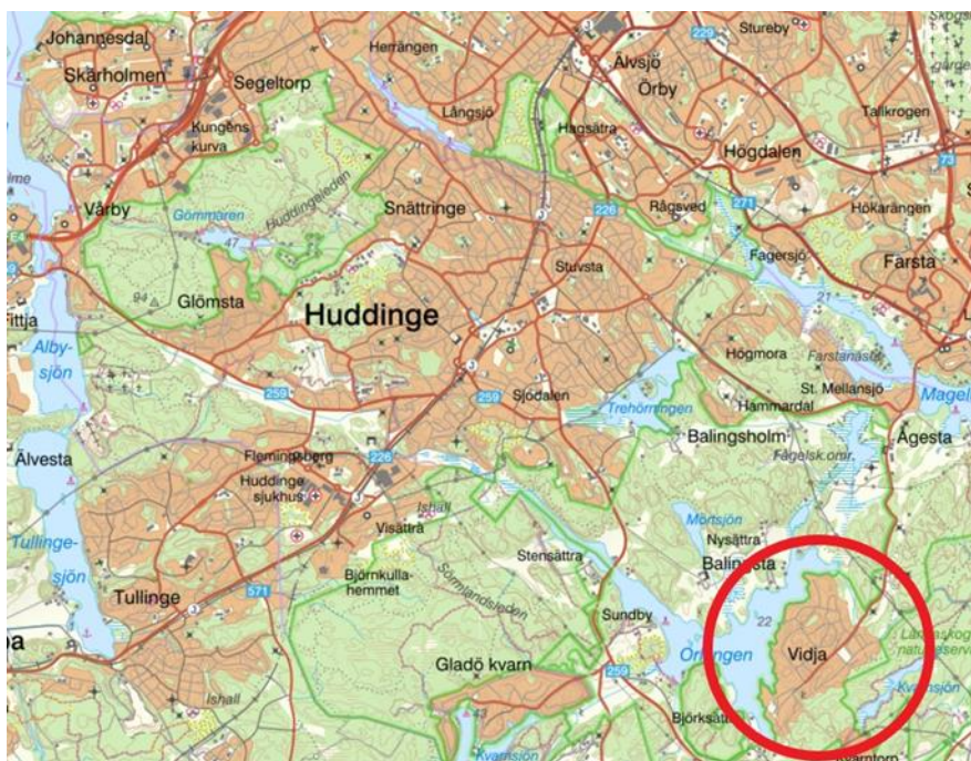
Figur 1 Översikt över Huddinge där Vidja markerats ut med en ring.

Vidja är ett omvandlingsområde där SVOA har arbetat med utbyggnaden av den allmänna VA-anläggningen i samråd med Huddinge kommun och deras utbyggnadsplan (ursprungligen antagen 2004, reviderad 2017), se figur 1 – Översikt Vidja.