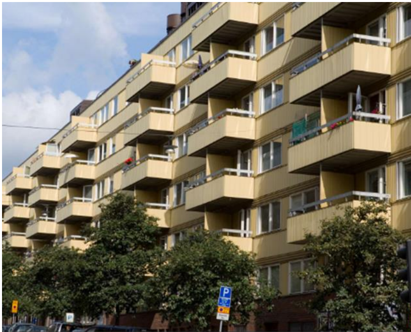
Bild 2: Fastigheten Trossen 13 bestående av vård- och omsorgsboendet Alströmerhemmet och servicehuset Fridhemmet.

Syftet med projektet är att fastigheten efter genomförd renovering fortsatt kan utgöra en tillgång avseende stadens bestånd av vård- och omsorgsboenden samt erbjuda seniorbostäder med fokus på trygghet och tillgänglighet. Målet är att genomföra nödvändiga underhållsåtgärder och utveckla en för staden strategiskt viktig fastighet.