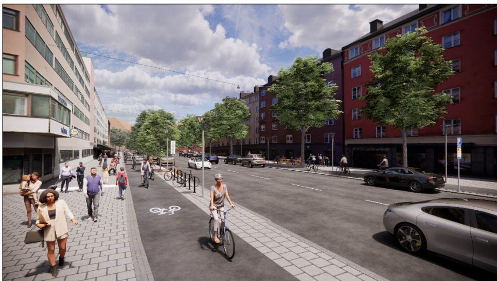
Figur 6. Genomgående gång- och cykelbana med bredare cykelbana i korsningen med Hälsingegatan.

Samtliga passager över anslutande gator kommer att utformas som genomgående gång- och cykelbanor vilket bedöms öka framkomligheten och trafiksäkerheten för både gående och cyklister.