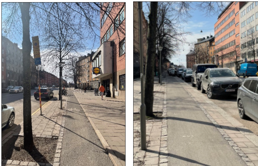
Figur 3. Cykelbanan mellan Hälsingegatan och Dalagatan. Bild till vänster: västra sidan. Bild till höger: östra sidan.

Cykelbanornas bredd uppgår till cirka 1,25 meter. Cykelbanan är placerad intill körbanan längs hela sträckan bortsett från på västra sidan mellan Hälsingegatan och Dalagatan där cykelbanan är placerad mellan gångbanan och trädplanteringen. Ca 1000 cyklister passerar sträckan per dygn.