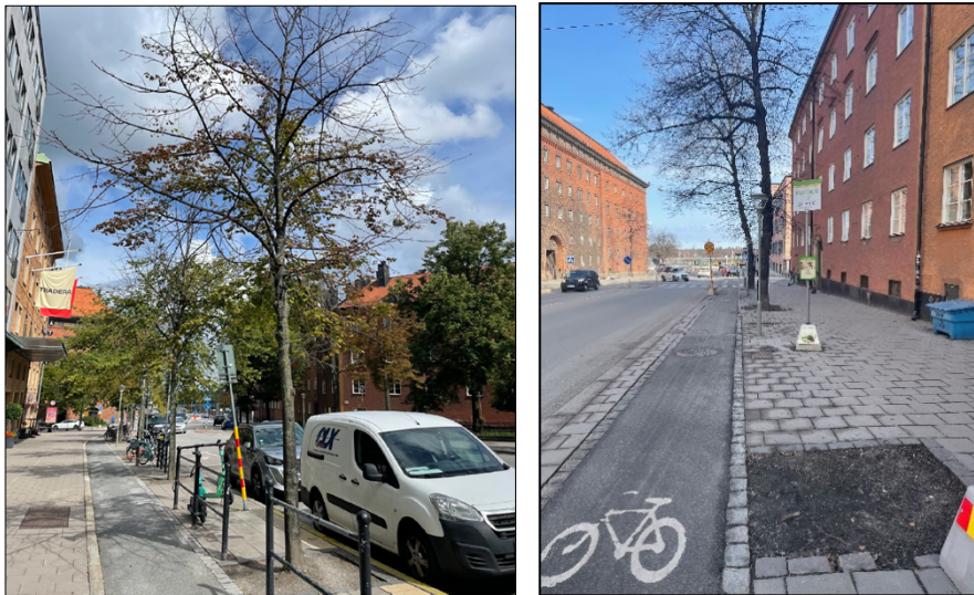
Figur 4. Till vänster: Lind vars vitalitet är mycket dålig. Sankt Eriksgatan mellan Hälsingegatan och Dalagatan. Till höger: markerad yta där träd tagits bort. Sankt Eriksgatan norr om Dalagatan.

I dagsläget finns totalt 34 träd längs sträckan. Majoriteten av träden har visat nedsatt eller mycket dålig vitalitet vid senaste trädinventeringar. Träden saknar växtbäddar och marken är kompakterad vilket begränsar rotutvecklingen och leder till brist på vatten och luft som behövs för trädens tillväxt. Kontoret har under åren tagit bort några av de döda träden. Längs aktuell sträcka finns därför ett flertal tomma trädgropar.