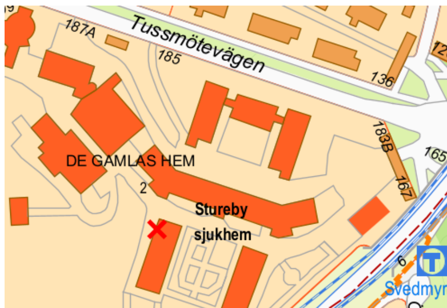
Kartbild över fastigheten De gamlas hem. Hus 173 markerat med X.

Hus 173 är ett demensgruppboställe med totalt 27 lägenheter fördelat på 3 plan med 9 lägenheter per plan. På varje plan finns gemensamt kök/matrum, vardagsrum, tvättstuga, förråd, expedition och inglasad balkong. Lägenheterna är fördelade på tre våningsplan och är på mellan 26-31 kvadratmeter stora. Fördelningen på tre våningsplan innebär högre personalkostnader jämfört med ett modernare boende med fler avdelningar på samma plan, särskilt då det till exempel krävs nattpersonal på alla plan för att säkerställa trygghet och säkerhet.