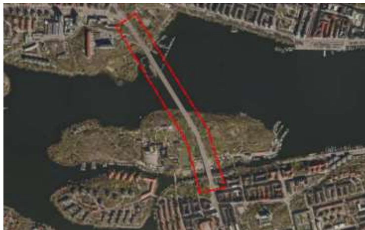
Bild 1: Västerbrons läge sträcker sig från Kungsholmen över Långholmen till Södermalm.

Västerbron invigdes och öppnades upp för trafik år 1935. Den närmare 970 meter långa bron sträcker sig över Riddarfjärden och Pålsundet, via Långholmen och sammanbinder Kungsholmen med Södermalm. Bron har sedan invigningen inte enbart varit en viktig strategisk länk, utan även kommit att bli ett av Stockholms mest kända landmärken. Bron används idag av alla trafikslag, men är framförallt en viktig koppling för gående, cyklister och kollektivtrafiken.