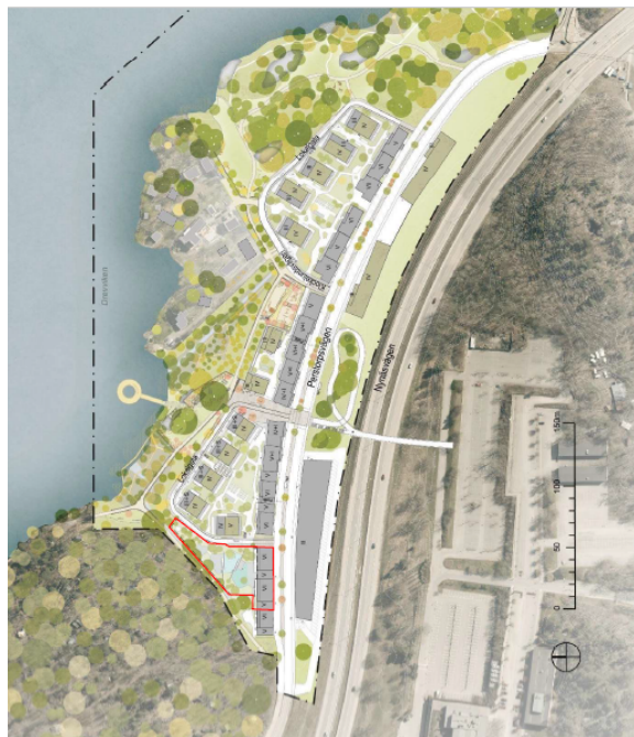
Förskolans placering i det nya bostadsområdet inritad på kartan

Farsta stadsdelsförvaltning har valt att gå vidare med ärendet då det nya bostadsområdet Klockelund med 600 lägenheter annars kommer stå utan förskoleplatser.