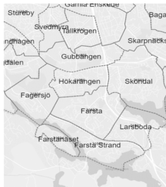
Stadsdelar i Farsta stadsdelsområde

Förvaltningen bedömer att behovet av förskoleplatser ökar än mer på sikt med anledning av planerad nybyggnation i Karlsvik som gränsar till Klockelund. För att möta tillkommande behov i området föreslår förvaltningen inrättandet av en ny lägenhetsförskola med fyra avdelningar. Förskolan planeras inrättas i de två nedersta planen i ett flerfamiljshus med tillhörande förskolegård om cirka 1 650 kvadratmeter. Det ger en friyta om ca 23 kvadratmeter per barn.