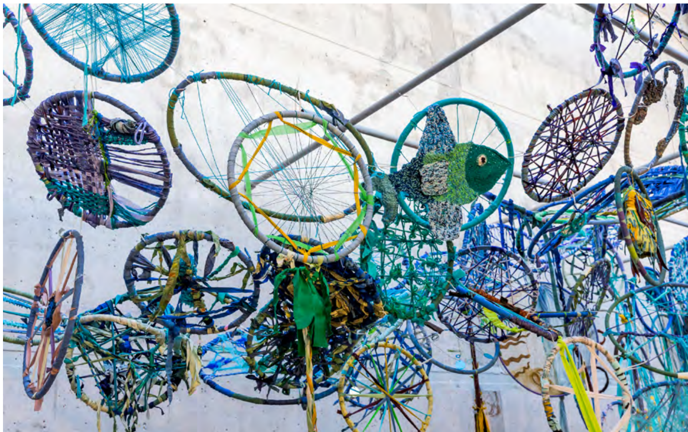
Nu blir det jättemycket av allting, Outsider Art 2022.