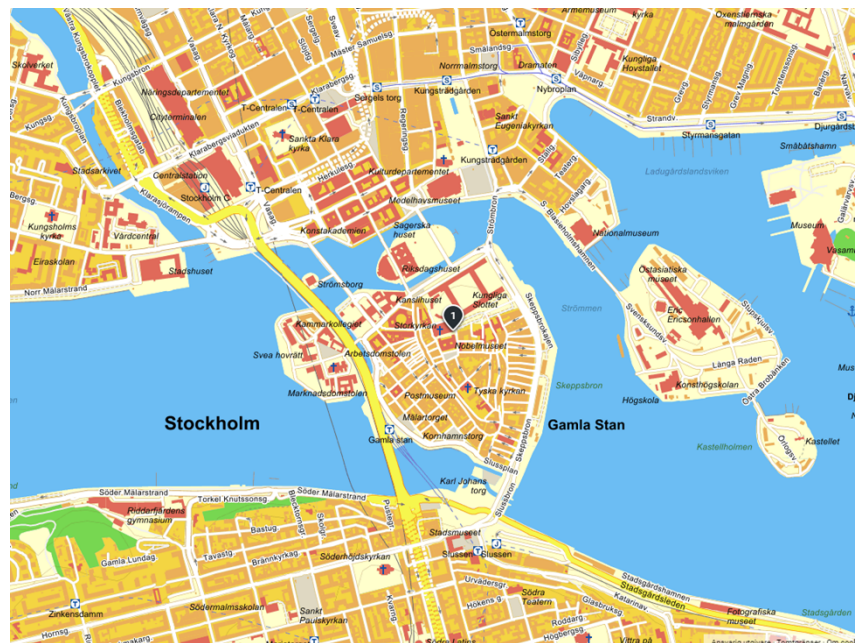
Karta med placering av Likkällaren.

Projektet är geografiskt placerat i Gamla stan mellan Börshuset och Storkyrkan samt Trångsund och Källargränd med postadressen 111 29 Stockholm. Fastighetsbeteckningen är Rådstugan 1.